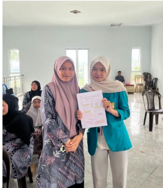
Gambar 4. Pembagian Flyer Edukasi Cek KLIK Kepada Peserta

Setelah kegiatan penyuluhan dan diskusi interaktif, peserta diberikan flyer edukasi Cek KLIK sebagai media penguatan informasi seperti pada Gambar 4. Media flyer digunakan karena mampu meningkatkan pemahaman dan daya ingat peserta terhadap pesan kesehatan yang disampaikan. Menurut World Health Organization (2020), penggunaan media komunikasi tertulis dalam promosi kesehatan membantu masyarakat mempertahankan informasi dan mendukung perubahan perilaku secara berkelanjutan. Oleh karena itu, pembagian flyer pada kegiatan ini diharapkan dapat membantu peserta menerapkan prinsip Cek KLIK secara mandiri dalam memilih produk kosmetik yang aman.