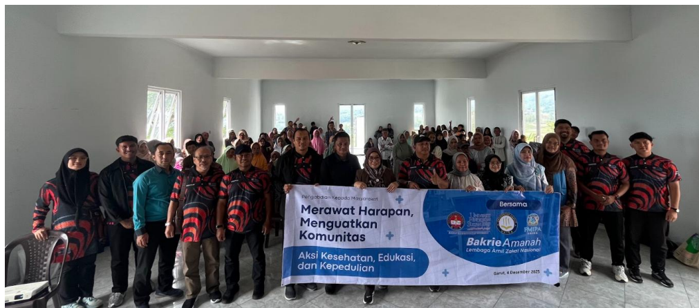
Gambar 2. Foto Bersama Kegiatan Pengabdian Kepada Masyarakat di Balai Desa Parakan.

Kegiatan Pengabdian kepada Masyarakat (PKM) dilaksanakan pada tanggal 4 Desember 2025 di Balai Desa Parakan, Kecamatan Samarang, Kabupaten Garut, dengan melibatkan 21 kader Pemberdayaan Kesejahteraan Keluarga (PKK) sebagai peserta. Kegiatan edukasi Cek KLIK (Kemasan, Label, Izin edar, dan Kedaluwarsa) dilaksanakan melalui penyampaian materi, diskusi interaktif, serta praktik pemeriksaan produk kosmetik. Dokumentasi pelaksanaan kegiatan disajikan pada Gambar 2 dan Gambar 3 sebagai gambaran proses penyuluhan yang berlangsung.