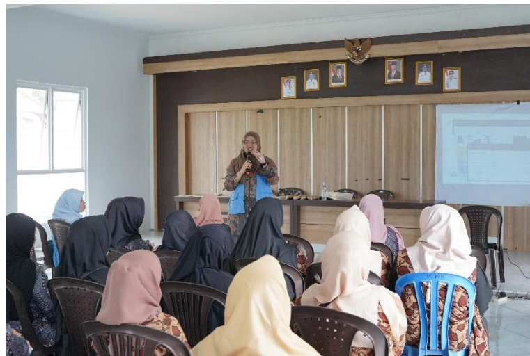
Gambar 3. Penyampaian Materi Edukasi Cek KLIK Kepada Kader PKK Desa Parakan.

Pelaksanaan kegiatan pengabdian kepada masyarakat ini juga didukung melalui kolaborasi akademik antara Universitas Garut, Universiti Pendidikan Sultan Idris (UPSI Malaysia), dan STIKes Karsa Husada Garut yang berkontribusi dalam proses penyampaian materi, pendampingan peserta, serta evaluasi kegiatan edukasi. Sinergi lintas institusi ini memungkinkan pertukaran perspektif keilmuan di bidang kesehatan dan pendidikan masyarakat sehingga pelaksanaan edukasi Cek KLIK berlangsung lebih interaktif dan aplikatif. Keterlibatan tim kolaboratif juga mendukung optimalisasi proses diskusi serta praktik pemeriksaan produk kosmetik, yang berkontribusi terhadap peningkatan partisipasi dan pemahaman peserta selama kegiatan berlangsung