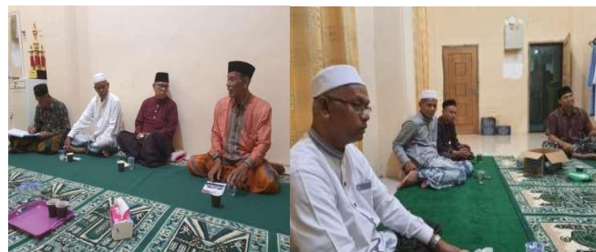
Gambar 2. Diskusi perdana

Tahap perencanaan program pendampingan diawali dengan pertemuan antara tim pengabdian dan pengurus Masjid Baitul Jannah Tungkop yang dilaksanakan di ruang pertemuan masjid, seperti yang terlihat pada gambar 2.