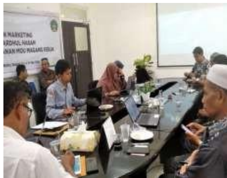
Gambar 6. Sosialisasi Koperasi

Selain itu, pelatihan juga menekankan pada tahapan pengurusan legalitas dan operasional koperasi, mulai dari pembentukan kelompok pendiri, penyusunan Anggaran Dasar/Anggaran Rumah Tangga (AD/ART), pelaksanaan rapat pembentukan, hingga proses pendaftaran badan hukum koperasi. Peserta juga diberikan pembekalan mengenai sistem administrasi, pencatatan keuangan sederhana, serta strategi pengembangan usaha koperasi berbasis potensi jamaah dan lingkungan sekitar masjid. Melalui peningkatan kapasitas ini, diharapkan lahir komitmen bersama untuk menjadikan koperasi sebagai salah satu instrumen pemberdayaan ekonomi jamaah. Pengurus tidak hanya memahami aspek teknis pembentukan, tetapi juga mampu mengelola koperasi secara transparan, akuntabel, dan berorientasi pada kemaslahatan umat. Dengan demikian, koperasi yang akan dibentuk di lingkungan masjid diharapkan dapat menjadi fondasi awal penguatan ekonomi masyarakat secara bertahap dan berkelanjutan.