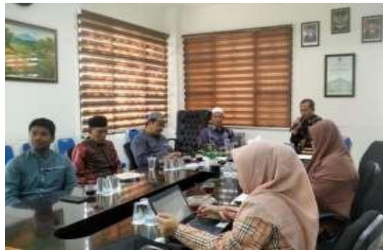
Gambar 7. Diskusi reflektif