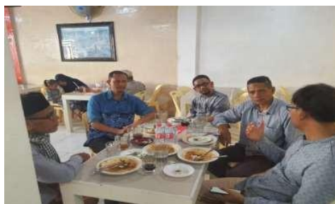
Gambar 3. Wawancara identifikasi potensi dan kelemahan

Tahap awal kegiatan pendampingan dilakukan melalui proses identifikasi dan pemetaan potensi serta permasalahan yang dihadapi oleh pengurus Masjid Baitul Jannah Tungkop dalam upaya pengembangan ekonomi jamaah. Tahapan ini merupakan bagian penting dalam pendekatan PAR karena menjadi dasar dalam merumuskan program pendampingan yang sesuai dengan kebutuhan mitra. Proses identifikasi dilakukan melalui observasi lapangan dan wawancara dengan pengurus masjid serta beberapa jamaah yang aktif mengikuti kegiatan masjid, seperti terlihat pada gambar 3.