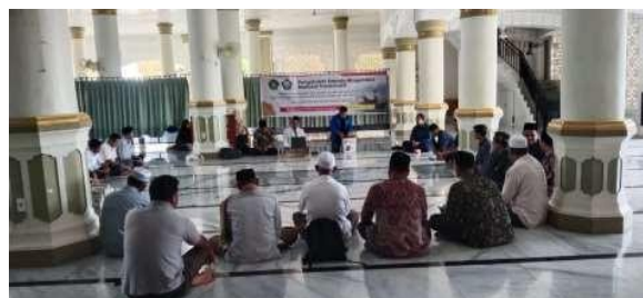
Gambar 5. Sharing pengalaman

Tahapan selanjutnya yang dilakukan adalah peningkatan pemahaman pengurus masjid dan calon pengurus koperasi mengenai model koperasi yang dapat dijalankan beserta tahapan pengurusan operasionalnya dan sharing pengalaman dari pembina Masjid Ar-Rifai Kota Medan, seperti yang terilaht pada gambar 5. Peningkatan kapasitas ini dilaksanakan melalui kegiatan sosialisasi dan pelatihan yang berfokus pada penguatan literasi koperasi syariah, mulai dari pemahaman konsep dasar, prinsip-prinsip koperasi, hingga mekanisme operasional yang sesuai dengan ketentuan perundang-undangan dan prinsip syariah. Materi yang disampaikan meliputi tujuan pembentukan koperasi, struktur organisasi, hak dan kewajiban anggota, sistem permodalan, serta pola pembagian Sisa Hasil Usaha (SHU). Dengan kegiatan ini, diharapkan pengurus masjid dan calon pengurus koperasi memiliki pemahaman yang utuh sehingga mampu merancang koperasi secara profesional dan berkelanjutan.