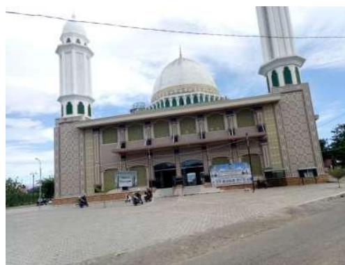
Gambar 1. Masjid Baitul Jannah Tungkop

Berdasarkan data Kementerian Agama, pada tahun 2021, di Kecamatan Darussalam, Kabupaten Aceh Besar terdapat sembilan masjid besar, salah satunya adalah Masjid Jamik Baitul Jannah yang beralamat di Jalan Masjid No. 1, Komplek Masjid Jamik Baitul Jannah, Kemukiman Tungkop. Dalam catatan sejarah, Masjid tersebut dibangun sebelum Indonesia merdeka melalui swadaya masyarakat. Seiring dengan berjalannya waktu, pertumbuhan penduduk yang meningkat signifikan, membuat Masjid Jamik Tungkop semakin banyak dikunjungi oleh jamaah, tidak kurang dari 1000 jamaah yang hadir ketika shalat jum'at. Melihat keadaan tersebut, pada tahun 2010, pengurus masjid merencanakan untuk memperluas kembali bangunan masjid. Panitia merancang bangunan masjid ini menjadi dua lantai, dengan luas bangunan 762m 2 , dan dibangun di atas lahan yang luasnya mencapai 9540m 2 . Bangunan baru masjid tersebut mampu menampung 3.500 jamaah. Tepat pada tahun 2011 dilakukan peletakan batu pertama, yang sumber pendanaan pembangunan masjid diperoleh dari sumbangan masyarakat dan bantuan Pemerintah (Jannah, 2019a).