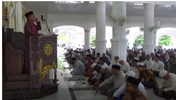
Gambar 4. Jamaah shalat jum'at

dikembangkan secara produktif. Selain itu, keberadaan kawasan pendidikan di sekitar wilayah Tungkop, yang berdekatan dengan Universitas Syiah Kuala dan Universitas Islam Negeri Ar-Raniry Banda Aceh, turut memberikan peluang bagi pengembangan aktivitas ekonomi berbasis komunitas. Di samping berbagai potensi tersebut, hasil identifikasi juga menunjukkan beberapa kendala yang dihadapi dalam pengembangan ekonomi jamaah. Salah satu kendala utama adalah belum adanya kelembagaan ekonomi yang terstruktur di lingkungan masjid yang dapat mengelola potensi ekonomi jamaah secara kolektif. Struktur organisasi pengurus masjid yang ada selama ini lebih berfokus pada pengelolaan kegiatan ibadah, pendidikan, dan pengelolaan aset, sehingga aspek pengembangan ekonomi belum menjadi bagian dari program kelembagaan masjid.