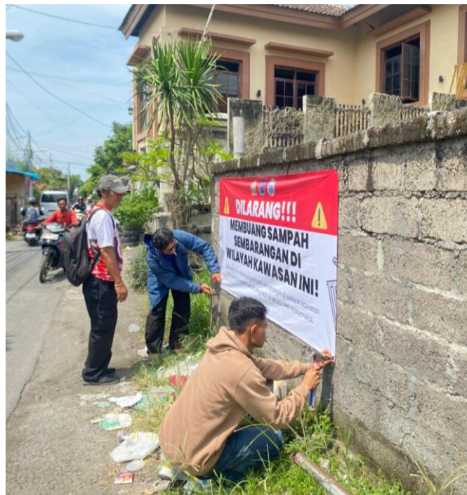
Gambar 3. Pemasangan banner di sekitar area Br. Pengiasan bersama kadus setempat

Selama proses pemasangan berlangsung, tim pengabdian juga melakukan sosialisasi insidental kepada warga yang berada di sekitar lokasi. Dialog singkat dilakukan untuk menjelaskan maksud dan tujuan pemasangan banner tersebut, yakni sebagai pengingat kolektif untuk menjaga kesucian dan kebersihan lingkungan desa. Interaksi ini bertujuan untuk membangun rasa kepemilikan ( sense of