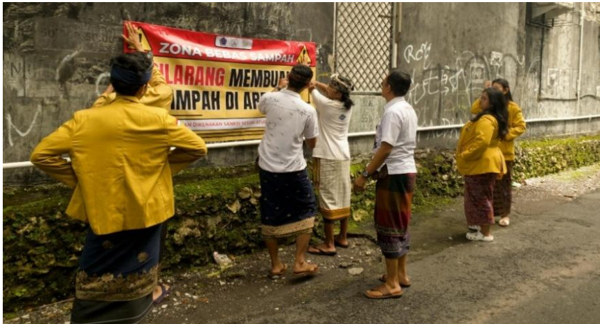
Gambar 2. Pemasangan banner di area Banjar Bumi Werdhi Bersama Kepala Dusun setempat

permanen yang tersedia, seperti pagar besi, tiang penyangga yang telah disiapkan, atau dinding pembatas lahan kosong yang tidak terawat. Hal ini menjamin bahwa banner tidak akan lepas atau rusak dalam jangka waktu lama, sehingga fungsi edukasinya tetap terjaga secara berkelanjutan. Prinsip ergonomi visual atau eye-level positioning diterapkan secara ketat dalam proses ini. Tim memastikan bahwa bagian tengah banner berada pada ketinggian rata-rata pandangan mata manusia, baik bagi mereka yang sedang berkendara sepeda motor maupun yang sedang berjalan kaki. Posisi ini dipilih karena secara psikologis lebih efektif dalam memicu perhatian spontan. Dengan penempatan sejajar arah pandang, pesan larangan membuang sampah dapat terserap oleh indra penglihatan dalam durasi paparan yang singkat (3 hingga 5 detik), yang sangat krusial bagi pengguna jalan yang sedang bergerak.