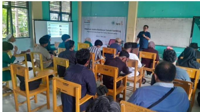
Gambar 6. Suasana ruang kelas

Peserta juga didorong untuk membentuk kelompok usaha, sehingga kegiatan peternakan dapat dijalankan secara kolektif berbasis pesantren. Pendekatan kolektif ini memungkinkan efisiensi dalam pembagian tugas, penggunaan lahan, dan pemasaran hasil ternak. Diskusi kelompok digunakan untuk menyusun rencana usaha sederhana berdasarkan potensi sumber daya lokal yang dimiliki.