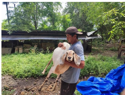
Gambar 3. Pemandahan induk kambing ke kandang baru

Pada sesi teknis, peserta memperoleh pemahaman menyeluruh mengenai berbagai aspek penting dalam budidaya kambing, mulai dari identifikasi dan pemilihan bibit unggul, desain dan manajemen kandang, manajemen pemberian pakan dan nutrisi, perawatan kesehatan ternak, hingga teknik reproduksi dan pengembangbiakan. Materi ini disampaikan secara komprehensif melalui kombinasi teori dan praktik langsung di lapangan. Peserta diajak untuk mengamati dan mencoba berbagai kegiatan teknis seperti pembersihan kandang, pemberian pakan, serta pemeriksaan kondisi fisik kambing secara langsung.