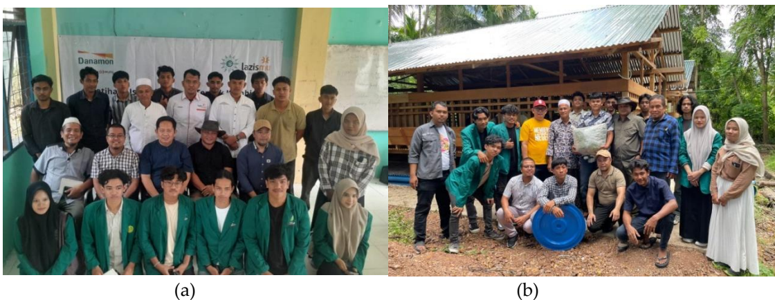
Gambar 7. (a) Foto bersama para peserta di ruang kelas, (b) Foto bersama para peserta di lapangan

Pelatihan diikuti oleh 32 peserta yang terdiri dari 17 santri, 2 pengelola pesantren, 3 pengurus LAZISMU, dan 10 warga sekitar pesantren. Antusiasme peserta sangat tinggi, terutama saat sesi praktik dan simulasi usaha. Banyak peserta menunjukkan ketertarikan untuk mengembangkan peternakan kambing lebih lanjut, bahkan beberapa di antaranya mulai menyusun rencana usaha sederhana sebagai tindak lanjut setelah pelatihan.