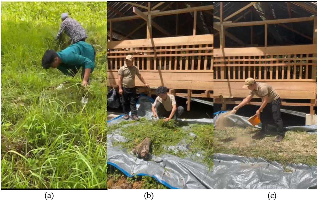
Gambar 4. (a) Memotong rumput sebagai sumber pakan kambing, (b) Memcacah rumput secara manual, (c) Mencampuri hijauan rumput dengan konsentrat

Pengetahuan teknis juga mencakup pengelolaan pakan lokal seperti rumput odot, daun singkong, dan leguminosa (lamtoro, turi, glirisidia) yang mudah dibudidayakan di sekitar pesantren. Peserta belajar tentang kebutuhan pakan berdasarkan bobot badan kambing serta teknik fermentasi dan pencampuran bahan untuk meningkatkan kandungan nutrisi pakan.