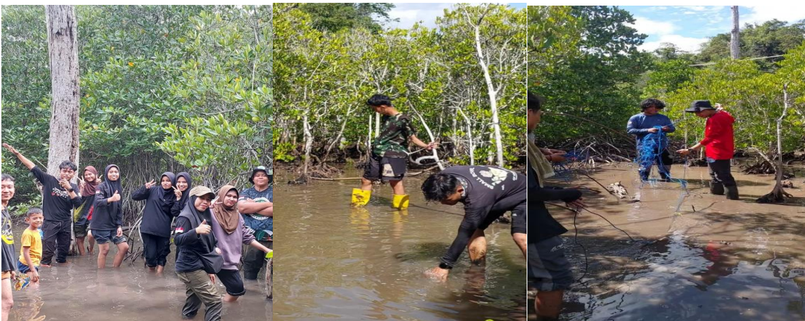
Gambar 2. Penanaman Tanaman mangrove / Bakau yang dilakukan masyarakat setempat, mahasiswa dan peneliti

Pada hari kedua, seluruh peserta turun langsung ke kawasan pesisir untuk melaksanakan kegiatan penanaman mangrove secara partisipatif (Gambar 2). Lokasi penanaman dipilih berdasarkan hasil identifikasi lapangan—area pantai di Desa Buhu Jaya yang mengalami abrasi parah dan kehilangan tutupan mangrove akibat konversi tambak. Sebelum kegiatan dimulai, tim peneliti memberikan arahan teknis singkat mengenai pemilihan bibit yang sehat, teknik penanaman yang sesuai dengan kondisi substrat berlumpur dan dinamika pasang surut, serta penentuan jarak tanam yang optimal.