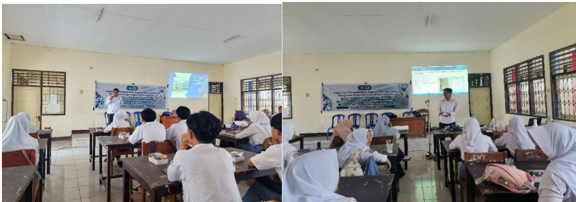
Gambar 3. Penyampaian Konsep Fisika dan Motivasi Belajar Fisika dan Pengenalan Modul Eksperimen.

Pelaksanaan pengabdian dimulai dengan penyampaian pengantar konsep fisika dan motivasi belajar serta dilanjutkan pengenalan modul eksperimen (Gambar 3). Pada praktek pelaksanaan, tim pengabdian mencoba mengikuti model pembelajaran berbasis eksperimen yang mengkombinasikan demonstrasi terarah dan praktik mandiri. Demonstrasi awal berfungsi menurunkan beban kognitif peserta sehingga pada tahap praktik mandiri siswa mampu fokus pada observasi data dan pemaknaan konsep. Pendekatan ini konsisten dengan temuan studi tentang guided-inquiry yang menunjukkan bahwa transisi dari demonstrasi terarah ke aktivitas praktis terstruktur meningkatkan pemahaman konseptual dan keterampilan laboratorium siswa (Petry dkk., 2016). Selain itu, penggunaan modul eksperimen berbasis sensor dan mikrokontroler memberi akses pengalaman hands-on atau praktek langsung yang relevan sekaligus meningkatkan motivasi belajar dari sebuah hasil yang didukung oleh studi pengembangan modul sensor di konteks sekolah menengah (Gambar 4). Di akhir sesi, peserta mengisi kuesioner untuk menangkap umpan balik terhadap kemanfaatan kegiatan (Gambar 5).