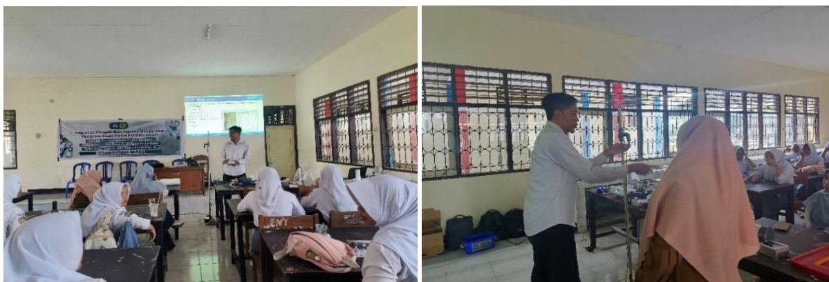
Gambar 4. Demonstrasi Gerak Jatuh Bebas Menggunakan Modul Timer yang Dikembangkan