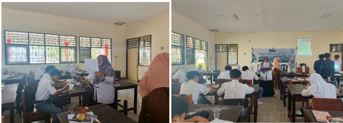
Gambar 5. Pengisian Kuisisioner Kegiatan Pengabdian Kepada Masyarakat di SMA 1 Praya Barat