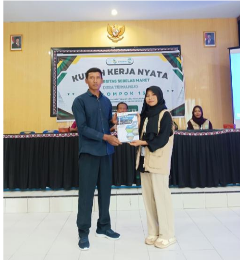
Gambar 4. Penyerahan Buku dan Video Profil

Buku profil dirancang untuk menjadi sarana promosi yang efisien guna memperkenalkan potensi desa kepada publik secara lebih luas (Atmojo, Zuhriyati, & Hanif, 2022). Selain itu, media ini berperan penting dalam menciptakan peluang kerja sama dan mempererat hubungan komunikasi dengan masyarakat maupun calon mitra bisnis (Fitriani, Erwin, & Widiyanti, 2022). Sedangkan video profil dirancang sebagai media branding guna memperluas jangkauan promosi, serta sebagai arsip digital untuk keperluan dokumentasi (Abdul Rohim & Danang Dwiwanto, 2023).