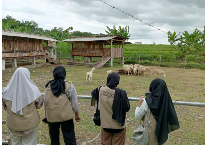
Gambar 2. Observasi Lapangan.