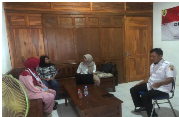
Gambar 1. Koordinasi Bersama Pemerintah Desa dan Pengurus BUMDes.

Tahap awal dilaksanakan melalui pertemuan dan diskusi terfokus bersama perangkat Desa Tegalrejo serta pengelola BUMDes Karya Cemerlang. Pertemuan ini bertujuan untuk menyamakan persepsi mengenai kebutuhan pendampingan informasi desa. Fokus utama koordinasi ini adalah memetakan potensi unit usaha yang sedang berjalan agar materi profil yang disusun nantinya selaras dengan rencana pengembangan ekonomi desa.