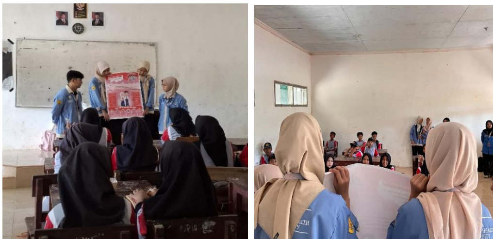
Gambar 3. Kegiatan Edukasi Pubertas.

Selanjutnya membuka dengan menyapa siswa-siswi kelas VII guna membangun komunikasi dan kebersamaan selama kegiatan berlangsung. Sebelum sesi penyampaian materi, peserta diminta mengisi pre-test untuk mengukur pengetahuan awal mereka terkait pubertas. Pre-test dilakukan menggunakan lembaran kertas dan berisikan 10 soal pilihan ganda yang berkaitan dengan materi yang akan disampaikan. Kegiatan inti dilanjutkan dengan sesi sosialisasi interaktif oleh penerjemah, yang menyajikan materi seputar tanda-tanda pubertas, perubahan fisik dan emosional, serta pentingnya menjaga kesehatan dan kebersihan diri. Penyampaian materi dilakukan secara menyenangkan dan komunikatif dengan bantuan media poster infografis yang menarik dan mudah dipahami.