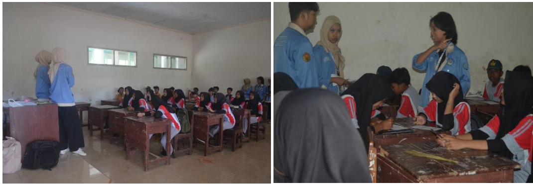
Gambar 2. Pelaksanaan Pre-test.

Selanjutnya membuka dengan menyapa siswa-siswi kelas VII guna membangun komunikasi dan kebersamaan selama kegiatan berlangsung. Sebelum sesi penyampaian materi, peserta diminta mengisi pre-test untuk mengukur pengetahuan awal mereka terkait pubertas. Pre-test dilakukan menggunakan lembaran kertas dan berisikan 10 soal pilihan ganda yang berkaitan dengan materi yang akan disampaikan. Kegiatan inti dilanjutkan dengan sesi sosialisasi interaktif oleh penerjemah, yang menyajikan materi seputar tanda-tanda pubertas, perubahan fisik dan emosional, serta pentingnya menjaga kesehatan dan kebersihan diri. Penyampaian materi dilakukan secara menyenangkan dan komunikatif dengan bantuan media poster infografis yang menarik dan mudah dipahami.