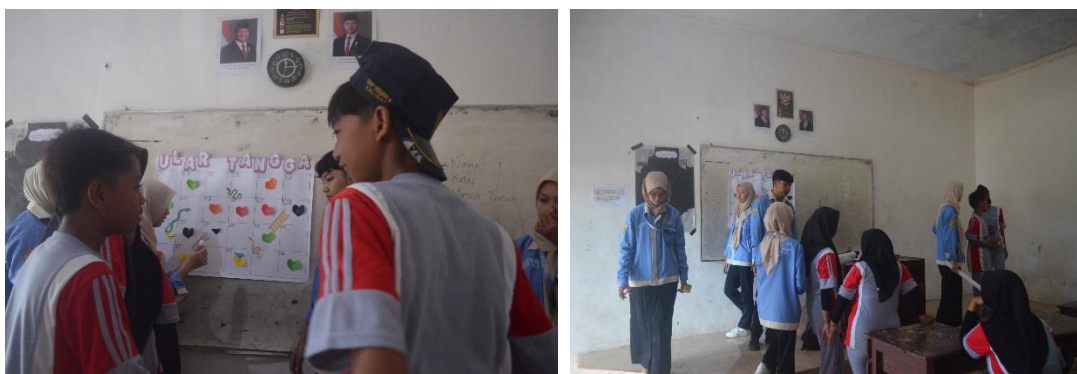
Gambar 4. Pengaplikasian Permainan Ular Tangga Pubertas

Dalam meningkatkan ketertarikan dan menambah keterlibatan peserta, disisipkan pula game edukatif ular tangga versi pubertas, yang berisi pertanyaan dan tantangan ringan terkait materi.