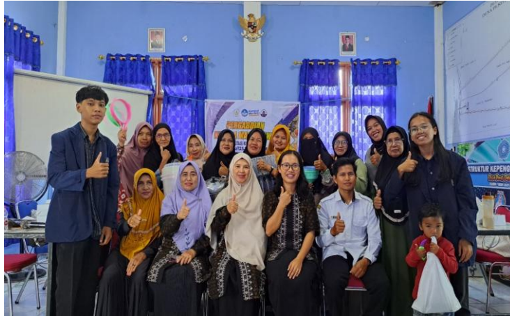
Gambar 9. Sesi foto antara pemateri, peserta kegiatan PKM, dan perangkat desa Peniti Dalam I

Evaluasi kegiatan PKM dilakukan dengan memberikan kuisioner yang telah dipersiapkan kepada setiap peserta PKM. Terdapat 8 pertanyaan pada kuisioner, dimana 8 pertanyaan adalah pertanyaan tertutup dan 1 pertanyaan adalah pertanyaan terbuka. Secara garis besar pertanyaan yang diajukan terkait dengan pengetahuan awal peserta terkait manfaat VCO, pengalaman penggunaan VCO, kemudahan memahami materi pelatihan, kemudian ketertarikan dan komitmen untuk membuat VCO.