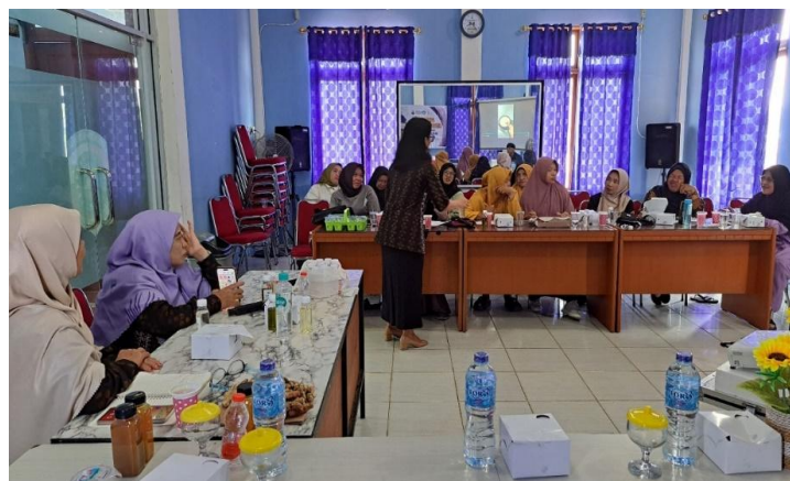
Gambar 5. Penyampaian materi PKM dalam sesi pelatihan pembuatan VCO dengan fermentasi alami

Kegiatan PKM dengan judul 'Pelatihan Pembuatan Virgin Coconut Oil (VCO) Bernilai Ekonomi untuk Meningkatkan Kesejahteraan Masyarakat di Sekitar KHDTK UNTAN, Desa Peniti Dalam I' diawali dengan sesi tanya jawab terkait pemahaman awal peserta terkait VCO. Setelah sesi tanya jawab, materi-materi dasar terkait VCO diberikan menggunakan perantara Power Point. Sesi pemberian pelatihan cara membuat VCO dengan cara fermentasi alami menjadi kegiatan puncak dari seluruh rangkaian kegiatan pelaksanaan PKM (Gambar 5). Pada kegiatan ini, pemateri juga memutar video cara pembuatan VCO yang telah direkam sebelumnya dengan detail. Tujuan pembuatan video ini adalah agar masyarakat mampu mengikuti proses pembuatannya di tempat mereka masing-masing.