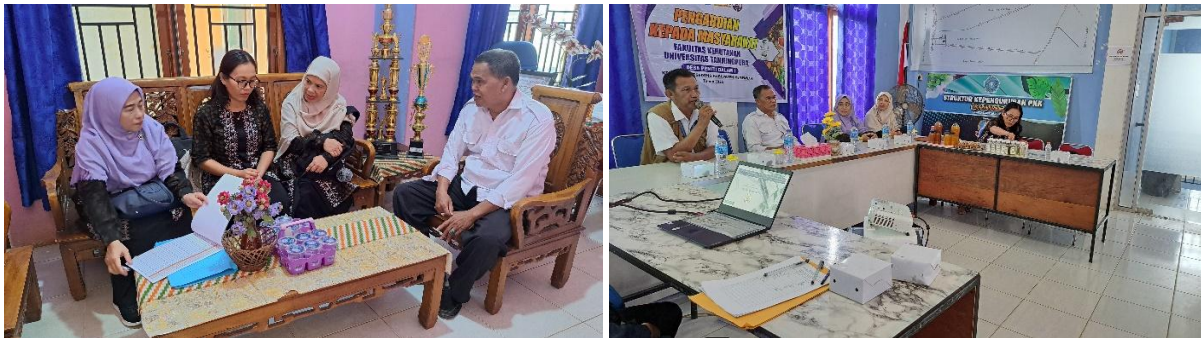
Gambar 4. Sambutan kepala desa (kiri) dan pembukaan kegiatan PKM oleh Kepala Desa Peniti Dalam I (kanan).

Kegiatan PKM dengan judul 'Pelatihan Pembuatan Virgin Coconut Oil (VCO) Bernilai Ekonomi untuk Meningkatkan Kesejahteraan Masyarakat di Sekitar KHDTK UNTAN, Desa Peniti Dalam I' diawali dengan sesi tanya jawab terkait pemahaman awal peserta terkait VCO. Setelah sesi tanya jawab, materi-materi dasar terkait VCO diberikan menggunakan perantara Power Point. Sesi pemberian pelatihan cara membuat VCO dengan cara fermentasi alami menjadi kegiatan puncak dari seluruh rangkaian kegiatan pelaksanaan PKM (Gambar 5). Pada kegiatan ini, pemateri juga memutar video cara pembuatan VCO yang telah direkam sebelumnya dengan detail. Tujuan pembuatan video ini adalah agar masyarakat mampu mengikuti proses pembuatannya di tempat mereka masing-masing.