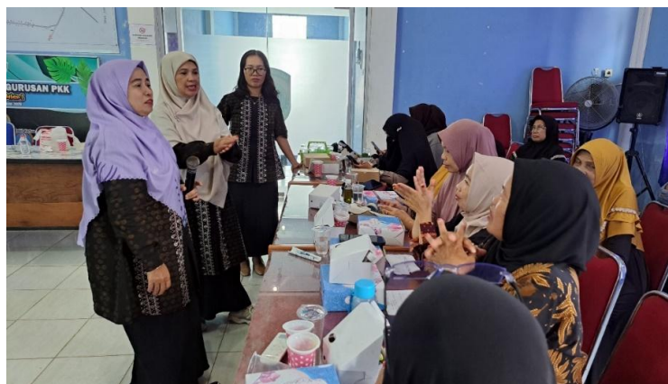
Gambar 8. Sesi tanya jawab antara peserta pelatihan dan pemateri

Di akhir sesinya, pemateri juga memberikan beberapa alat dan bahan sederhana dalam pembuatan VCO kepada masyarakat (Gambar 7). Melalui pemberian alat dan bahan sederhana ini diharapkan ibu-ibu PKK dapat mempraktekkan pembuatan VCO dalam kelompok mereka. Masyarakat juga menyatakan komitmennya untuk mempraktekkan pembuatan VCO di kelompok ibu-ibu PKK. Antusias masyarakat terlihat begitu tinggi terhadap materi pelatihan pembuatan VCO ini. Berbagai pertanyaan yang dilontarkan ibu-ibu PKK kepada pemateri terjadi sepanjang kegiatan PKM dan membuat suasana PKM begitu hangat (Gambar 8). Kegiatan PKM diakhiri dengan sesi foto antara pemateri, peserta kegiatan, dan perangkat desa Peniti Dalam I (Gambar 9).