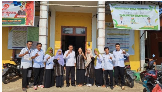
Gambar 2. Lokasi pelaksanaan kegiatan PKM Dosen Fakultas Kehutanan, UNTAN di Desa Peniti Dalam I.

23 Juli 2025. Kegiatan PKM dilakukan di kantor desa Peniti Dalam I, Kecamatan Segedong, Kabupaten Mempawah (Gambar 2).