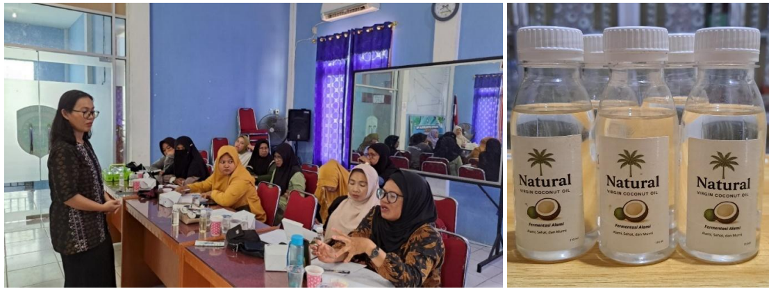
Gambar 6. Pemberian VCO (kiri) dari sampel yang telah dipersiapkan untuk masyarakat (kanan)