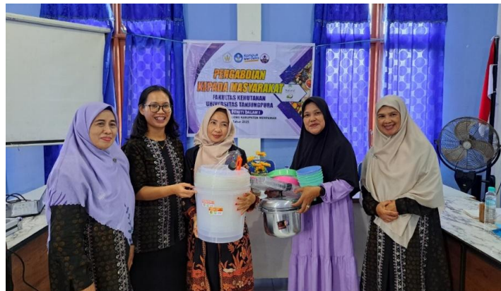
Gambar 7. Pemberian alat dan bahan sederhana dalam pembuatan VCO kepada peserta PKM

Di akhir sesinya, pemateri juga memberikan beberapa alat dan bahan sederhana dalam pembuatan VCO kepada masyarakat (Gambar 7). Melalui pemberian alat dan bahan sederhana ini diharapkan ibu-ibu PKK dapat mempraktekkan pembuatan VCO dalam kelompok mereka. Masyarakat juga menyatakan komitmennya untuk mempraktekkan pembuatan VCO di kelompok ibu-ibu PKK. Antusias masyarakat terlihat begitu tinggi terhadap materi pelatihan pembuatan VCO ini. Berbagai pertanyaan yang dilontarkan ibu-ibu PKK kepada pemateri terjadi sepanjang kegiatan PKM dan membuat suasana PKM begitu hangat (Gambar 8). Kegiatan PKM diakhiri dengan sesi foto antara pemateri, peserta kegiatan, dan perangkat desa Peniti Dalam I (Gambar 9).