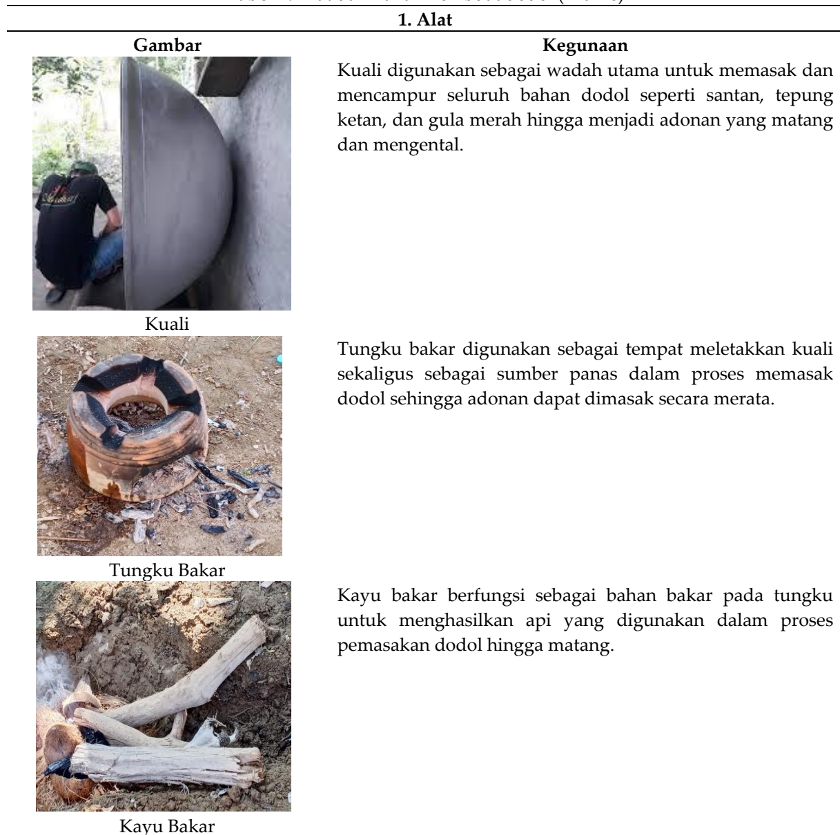
Tabel 1. Alat dan Bahan Pembuat dodol (Alame)

alat, mengikuti prosedur, packing, dan distribusi ke pembeli dan Masyarakat. Beberapa alat yang digunakan dalam proses pembuatan dodol antara lain: kualii besar, tungku kayu bakar sendok atau pengaduk kayu panjang, baskom, daun pandan atau plastik pembungkus (Tabel 1). Alat-alat tersebut digunakan untuk mendukung proses pembuatan dodol secara tradisional yang masih mempertahankan cara memasak menggunakan tungku kayu bakar. Bahan yang digunakan dalam pembuatan dodol meliputi: tepung beras ketan, santan kelapa, gula merah, gula pasir, garam secukupnya, daun pandan (sebagai penambah aroma). Bahan-bahan tersebut merupakan bahan dasar yang umum digunakan dalam pembuatan dodol tradisional sehingga menghasilkan cita rasa yang khas dan legit.