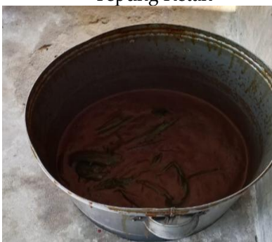
Gula Merah dan Garam

Tepung ketan berfungsi sebagai bahan utama pembentuk tekstur dodol. Kandungan pati di dalamnya membuat dodol menjadi kental, kenyal, dan elastis setelah dimasak.