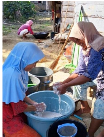
Gambar 1. Proses memeras santan kelapa