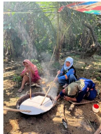
Gambar 2. Memasak santan dikuali

Pelaksanaan tradisi mangalame di Desa Aek Ngadol umumnya dilakukan sejak pagi hari hingga menjelang sore. Kegiatan ini dilakukan secara bersama-sama oleh masyarakat sebagai bentuk kebersamaan dan gotong royong dalam melestarikan tradisi yang telah diwariskan secara turun-temurun. Dalam proses pembuatannya, masyarakat bekerja sama mulai dari menyiapkan bahan, menyalakan tungku, hingga mengaduk adonan dodol secara bergantian. Adapun alat dan bahan utama yang digunakan dalam pembuatan alame terdiri dari beberapa komponen yang berperan penting dalam menghasilkan tekstur dan cita rasa khas dari dodol tradisional tersebut