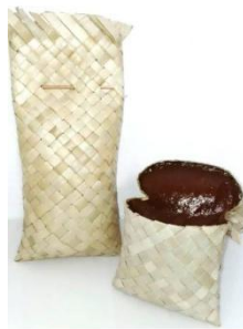
Gambar 3. Alame siap dikonsumsi

Selain memiliki makna sosial dan filosofis, kegiatan mangalame yang dilaksanakan di Desa Aek Ngadol juga memiliki makna pemberdayaan ekonomi masyarakat. Melalui kegiatan ini, masyarakat dapat memproduksi dodol alame dibungkus daun pandan (Gambar 3) yang memiliki nilai ekonomi dan dapat dijadikan sebagai salah satu produk khas daerah Tapanuli Selatan. Tradisi ini bahkan dapat dikembangkan sebagai produk kuliner lokal yang bernilai ekonomi serta menjadi bagian dari potensi wisata budaya daerah Mandailing (Nasution, 2023).