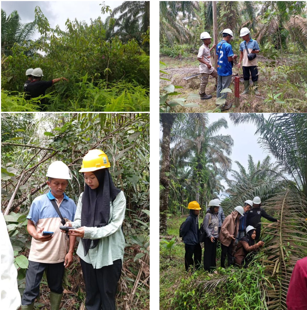
Gambar 3. Peserta melakukan praktik pengukuran lahan secara langsung di lapangan

Pelaksanaan pengukuran menunjukkan bahwa penentuan titik batas lahan tidak selalu dapat dilakukan secara langsung dan mudah. Di beberapa lokasi, patok batas tidak ditemukan atau sudah tertutup oleh semak dan vegetasi rapat, sehingga peserta harus mengandalkan informasi pemilik lahan serta ciri-ciri alam seperti parit, pohon penanda, atau perbedaan tanaman sebagai acuan batas. Kondisi ini memerlukan diskusi singkat di lapangan untuk mencapai kesepakatan bersama mengenai posisi batas yang dianggap paling representatif. Proses tersebut memperlihatkan bahwa pemetaan lahan di tingkat masyarakat tidak hanya bergantung pada alat, tetapi juga pada pengetahuan lokal dan komunikasi antar pihak.