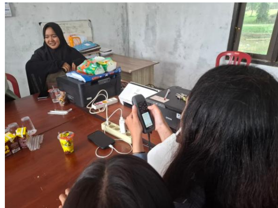
Gambar 2. Pemaparan materi dan simulasi penggunaan alat GPS