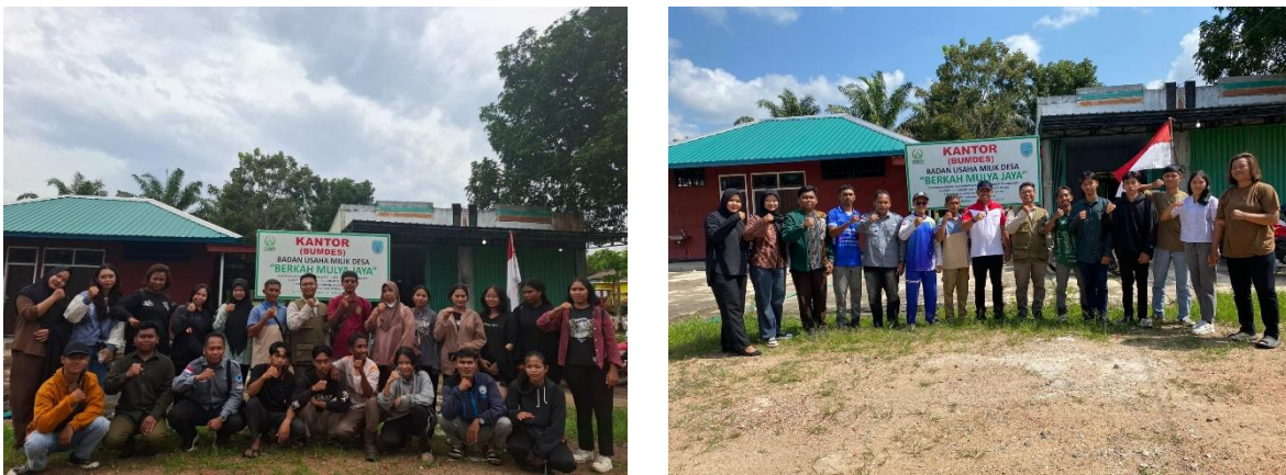
Gambar 5. Foto Bersama peserta praktik langsung di lahan (kiri) dan peserta pengolahan data (kanan) beserta Pemerintah Desa Mekar Mulya dan pengurus BUM Desa Berkah Mulya Jaya.

Meskipun demikian, penilaian kelayakan tersebut belum didukung oleh evaluasi kuantitatif terhadap parameter penting seperti akurasi posisi serta kelengkapan dan konsistensi atribut sesuai pedoman sertifikasi. Oleh karena itu, klaim bahwa data tersebut “layak” sebagai pendukung sertifikasi perlu dipahami sebagai bersifat indikatif dan terbatas pada tahap awal, yang masih memerlukan validasi teknis lebih lanjut. Secara kelembagaan, ketersediaan data spasial ini tetap memberikan kontribusi strategis dalam memperkuat peran BUM Desa sebagai pengelola usaha berbasis data, khususnya sebagai dasar awal dalam pemutakhiran database kebun anggota kelompok tani. Dengan demikian, luaran kegiatan tidak hanya berdampak pada peningkatan kapasitas individu peserta, tetapi juga berkontribusi terhadap penguatan fungsi kelembagaan desa dalam tata kelola wilayah berbasis informasi. Adapun kegiatan evaluasi ini kemudian ditutup dengan foto bersama antara peserta, Pemerintah Desa Mekar Mulya, dan pengurus BUM Desa Berkah Mulya Jaya.