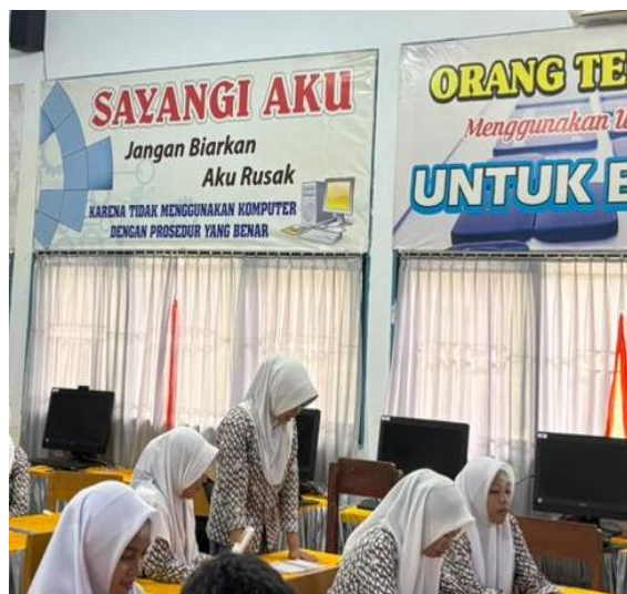
Gambar 3. Sesi Tanya Jawab

Setelah penyampaian materi, kegiatan dilanjutkan dengan sesi tanya jawab. Pada sesi ini, siswa terlihat antusias dengan mengajukan beberapa pertanyaan terkait pengalaman dan pemahaman mereka mengenai bullying. Hal ini menunjukkan adanya ketertarikan serta peningkatan kesadaran siswa terhadap isu yang dibahas.