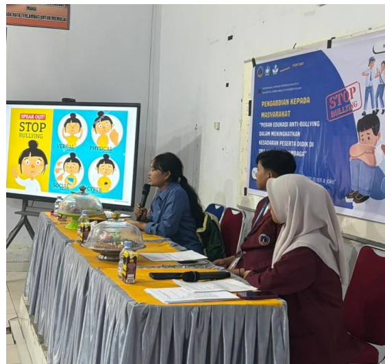
Gambar 2. Pemberian Eduasi Anti Bullying

secara verbal, fisik, ataupun sosial di dunia nyata maupun dunia maya yang membuat seseorang merasa tidak nyaman, sakit hati dan tertekan baik dilakukan oleh perorangan ataupun kelompok (Nuraeni & Gunawan, 2021).