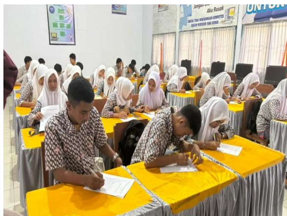
Gambar 1. Sesi Pre Kuesioner.

Setelah sesi pembukaan, kegiatan dilanjutkan dengan pembagian pre-kuesioner kepada seluruh peserta. Pre-kuesioner ini bertujuan untuk mengetahui tingkat pemahaman awal siswa terkait pengertian bullying, jenis-jenisnya, serta dampak yang ditimbulkan. Berdasarkan hasil pre-kuesioner, diketahui bahwa sebagian besar siswa masih memiliki pemahaman yang terbatas terkait bullying. Siswa umumnya hanya mengenali bullying dalam bentuk fisik, sementara bentuk lain seperti verbal, sosial, dan cyberbullying belum dipahami dengan pasti.