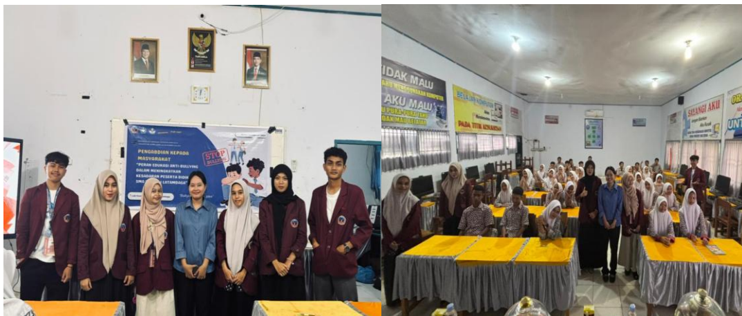
Gambar 5. Sesi Foto Bersama

Dengan meningkatnya pemahaman siswa mengenai perilaku bullying beserta dampaknya, diharapkan siswa memiliki kesadaran untuk menghindari tindakan bullying serta mampu menumbuhkan sikap empati dan saling menghargai antar sesama. Selain itu, pada sesi akhir kegiatan sosialisasi, diberikan kuis kepada peserta sebagai bentuk evaluasi pemahaman. Siswa yang berhasil menjawab pertanyaan dengan benar diberikan apresiasi berupa hadiah. Selanjutnya, kegiatan ditutup dengan pemberian sertifikat kepada pemateri sebagai bentuk penghargaan atas kontribusinya dalam menyampaikan materi sosialisasi, serta diakhiri dengan sesi foto bersama sebagai dokumentasi pelaksanaan kegiatan pengabdian kepada masyarakat.