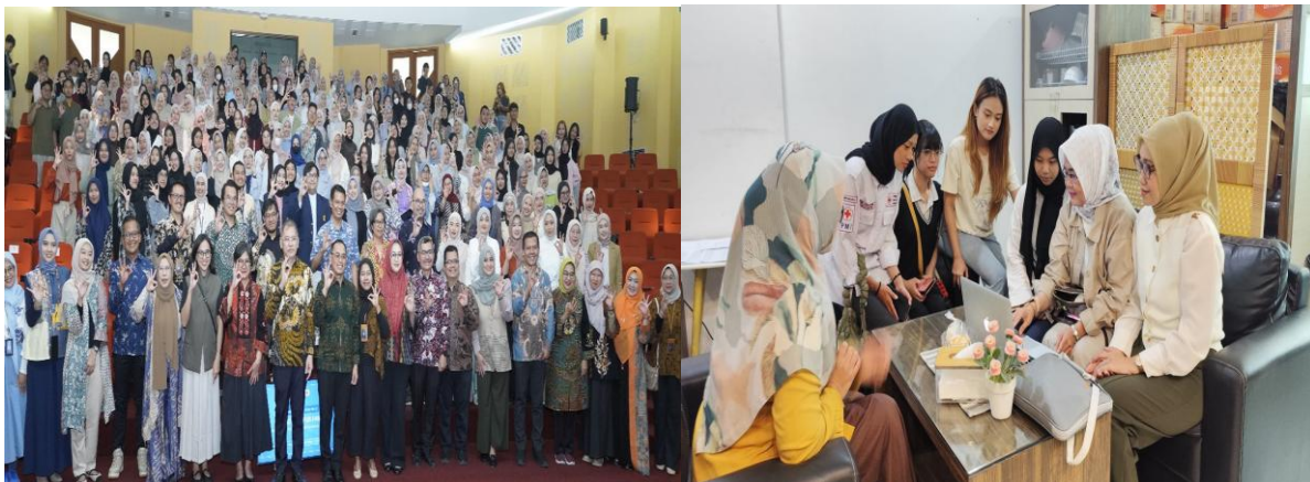
Gambar 1. Sosialisasi Aplikasi Kasir Android, Kantor Jasa Akuntan.

Kantor Jasa Akuntan (KJA) memiliki peran strategis sebagai mitra profesional UMKM. KJA tidak hanya berperan dalam penyusunan laporan keuangan, tetapi memberikan layanan pembukuan, konsultasi manajemen, perpajakan, serta sistem informasi akuntansi yang relevan dengan kebutuhan digitalisasi usaha. Berdasarkan regulasi dan praktik profesional, KJA dapat menjadi pendamping utama bagi UMKM dalam menerapkan SAK EMKM, digital bookkeeping, aplikasi kasir digital, dan dashboard keuangan berbasis smartphone sehingga kualitas tata kelola usaha menjadi lebih transparan dan akurat (Hertati & Iriyadi, 2023).