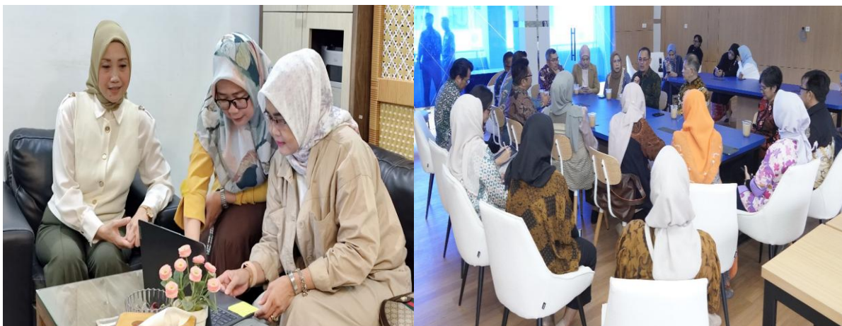
Gambar 2. Foto Pelaksanaan Kegiatan Kalaborasi PKM

Tujuan kolaborasi menciptakan ekosistem pemberdayaan UMKM yang berkelanjutan, meningkatkan akses pasar dan pembiayaan, serta memperluas dampak ekonomi masyarakat melalui transformasi usaha dari sistem tradisional menuju bisnis digital berbasis smartphone (Badrudin et al., 2025). Transformasi digital dan literasi keuangan menjadi kunci utama agar UMKM dapat bertahan dan naik kelas menggunakan pendekatan partisipatif dan pendampingan berbasis praktik langsung kepada pelaku UMKM. Kegiatan diawali dengan identifikasi kebutuhan dan permasalahan UMKM, khususnya pada pengelolaan keuangan, pembayaran digital, dan pemasaran berbasis smartphone. Selanjutnya dilakukan edukasi dan pelatihan mengenai pentingnya keuangan digital, penggunaan aplikasi kasir Android, mobile banking, QRIS, serta strategi digital marketing untuk meningkatkan penjualan (Ho et al., 2025).