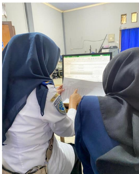
Gambar 3. Proses pendampingan rekapitulasi TPP.

Pendampingan administrasi rekapitulasi Tambahan Penghasilan Pegawai (TPP) pada dinas perhubungan Kabupaten Bangkalan