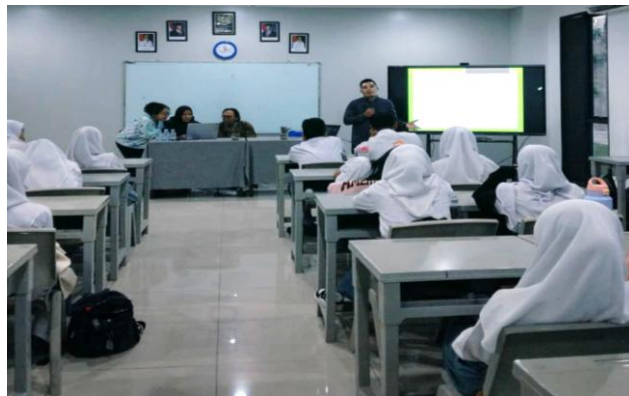
Gambar 3. Pemberian materi sesi 1

memberikan pelatihan produksi Citizen journalism diantaranya penulisan naskah dan teknik sinematografi. Pendampingan dan pelatihan penulisan naskah bertujuan untuk memberikan pemahaman dalam menyusun sebuah informasi yang akan dipublish dimedia sosial agar bisa di pertanggung jawabkan dan terhindar dari hoax, pelatihan teknik sinematografi untuk memberikan pemahaman skil dalam teknik mengambil video dengan menggunakan smartphone. Hasil dari pelatihan dan pendampingan diupload pada portal web atau situs web yang digunakan untuk tujuan tertentu dan mengarahkan pembaca supaya melihat, membaca, dan berinteraksi dengan informasi pada situs website tersebut. Secara teknis, portal merupakan penyedia layanan informasi khusus untuk menarik minat pembaca agar masuk pada halaman website yang dicari, serta dapat diakses melalui berbagai perangkat seperti desktop, mobile, dan tablet ( https://www.sekawanmedia.co.id , 2025))Adapun dari dua materi yang diberikan bertujuan untuk memberikan skill dalam membuat sebuah konten berisikan sebuah informasi yang bisa di pertanggung jawabkan keaslian, fakta dan data yang di publish di media sosial dan visual yang di sajikan terstruktur dan menarik.