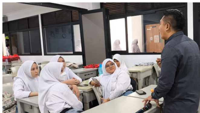
Gambar 7. Pendampingan praktik proses pembuatan video

Sesi keempat adalah sesi dimana peserta diberikan pendampingan dalam mencari ide untuk sebuah konten untuk diproduksi menjadi konten Citizen journalism , siswa-siswi dibuat menjadi kelompok-kelompok kecil. Dari tiap kelompok diberikan tugas untuk membuat sebuah konten, dari ide,