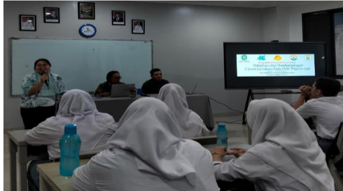
Gambar 5. Pemberian materi sesi 3

Sesi kedua tim pendampingan memberikan materi pembekalan teknik sinematografi dimana dalam materi tersebut diberikan pembelajaran berkaitan dengan teknik pengambilan visual dan teknik editing dengan menggunakan smartphone. Meliputi framing gambar, angle kamera dan proses editing dengan aplikasi capcut. Tujuan dari pembekalan ini agar siswa-siswi pelatihan dapat mengambil visual secara teknis benar, menarik dan sinematik.