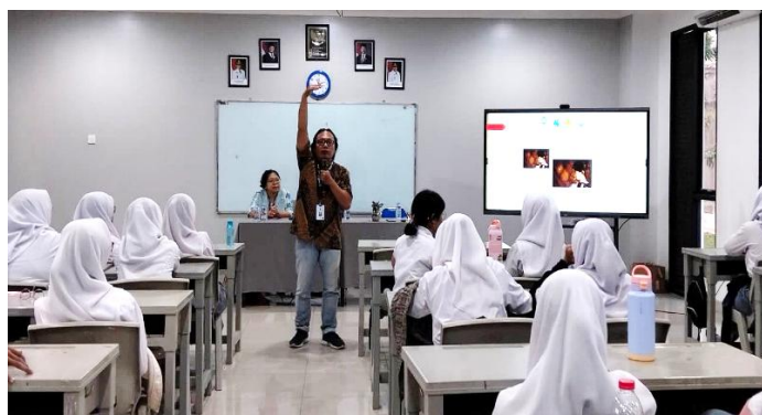
Gambar 4. Pemberian materi sesi 2

Pada sesi 1 siswa-siswi diberikan materi pembekalan untuk teknik penulisan naskah. Adapun dalam materi tersebut meliputi teknik dalam mengumpulkan data sumber informasi, teknik wawancara dan menyusunnya ke dalam draft naskah dengan format 5W1H, sesuai dengan kaidah penulisan jurnalistik. Pada dasarnya, definisi dari 5W 1H ini adalah sebuah panduan yang berisikan pertanyaan-pertanyaan untuk menyusun sebuah teks berita (Badriyah, 2026). Tujuan dari pembekalan ini adalah agar siswa-siswi dapat menerapkan konsep penulisan jurnalistik kedalam postingan yang mereka buat di media sosial agar dapat memberikan informasi yang benar dan dapat dipertanggung jawabkan kebenarannya. Mengingat dalam teks berita juga memiliki struktur tersendiri. Menurut Romli (2018), struktur teks berita ini ada 3, yakni orientasi berita, peristiwa, dan sumber berita. Dari ketiga unsur tersebut harus dipahami peserta untuk dapat menulis berita dengan benar dan dapat dipertanggung jawabkan.