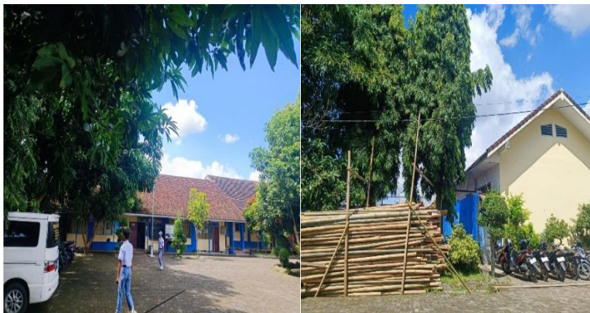
Gambar 1. Kondisi SMK Muhammadiyah 3 Ambulu

Selain itu, berbagai penelitian menunjukkan bahwa peralatan seperti AC, komputer laboratorium, dan perangkat praktik teknik menjadi penyumbang konsumsi energi terbesar di lingkungan sekolah (Zebua, 2022). Tanpa alat bantu analisis, sekolah kesulitan memetakan konsumsi energi secara kuantitatif. Padahal, audit energi dan perhitungan berbasis spreadsheet terbukti efektif dalam memetakan penggunaan energi dan potensi penghematannya (Syahri et al., 2024; Wahid, 2014).