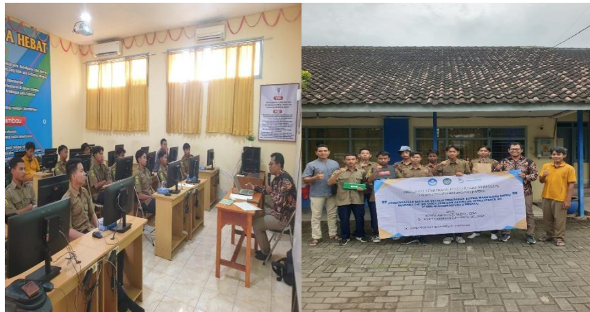
Gambar 2. Sosialisasi dan pemaparan materi

Keberhasilan program dievaluasi melalui teknik triangulasi data yang meliputi angket literasi, wawancara mendalam, dan observasi perilaku secara langsung. Hasil analisis angket menunjukkan peningkatan pemahaman responden sebesar 40% terkait prinsip efisiensi energi. Secara kualitatif, hasil wawancara mengungkap adanya komitmen kuat dari manajemen sekolah untuk melegalkan SOP energi ke dalam regulasi internal. Observasi lapangan mengonfirmasi terjadinya perubahan perilaku nyata, seperti optimalisasi suhu pendingin ruangan pada level 24°C–25°C dan disiplin pemutusan daya peralatan pasca-praktikum. Perubahan perilaku ini mendukung penelitian dari (Shirrim & Trubaev, 2017) yang menyatakan bahwa keberlanjutan efisiensi energi sangat bergantung pada internalisasi budaya hemat energi oleh pengguna instrumen teknis. Sosialisasi dan pemaparan materi guna meningkatkan literasi energi disajikan pada Gambar 2.