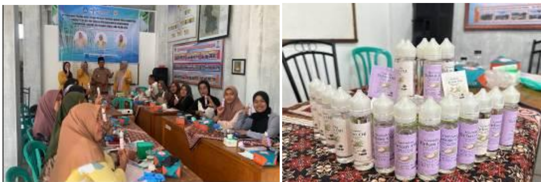
Gambar 6. Produk Inovasi Minyak Telon Oil

Selanjutnya, pemberian materi terkait pelatihan digital brand marketing, materi yang diberikan terkait labeling. Pengembangan produk di lihat dari inovasi labeling (Rico Elhando Badri et al., 2022). Label pada produk memiliki informasi seperti nama produk, merek dan komposisi bahan yang di gunakan (Rinaldi et al., 2024). Selain itu, peserta kelompok tani sukma nusantara juga langsung praktek dalam pemasangan label pada pada botol minyak telon sereh wangi. Dapat dilihat pada gambar 5 dan 6.