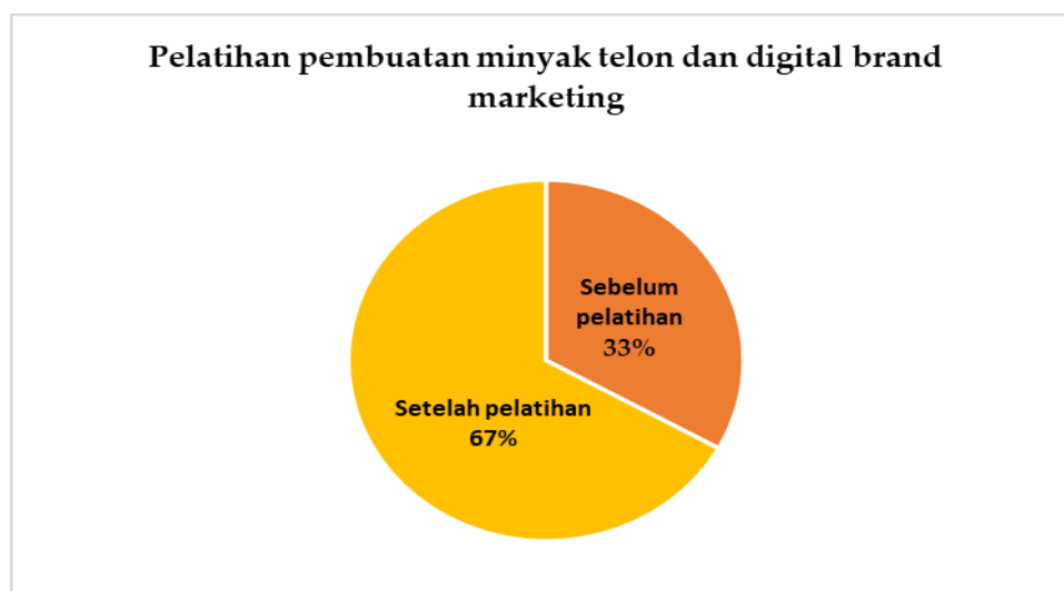
Gambar 7. Pelatihan pembuatan minyak telon dan digital brand marketing

Berdasarkan hasil kegiatan pelatihan pembuatan minyak telon dan digital brand marketing menunjukkan adanya peningkatan yang signifikan pada tingkat pemahaman dan keterampilan Optimalisasi produk sereh wangi melalui pelatihan digital brand marketing, inovasi telon oil, dan edukasi kesehatan untuk mewujudkan kemandirian ekonomi masyarakat gurun, Kabupaten Lima Puluh Kota