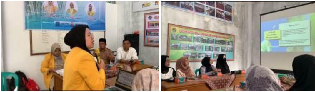
Gambar 2. Pemberian Materi Edukasi Kesehatan Minyak Telon

Berdasarkan hasil kegiatan, pemberian materi edukasi kesehatan terkait minyak telon memberikan dampak yang signifikan dalam meningkatkan pemahaman dan keaktifan kelompok tani sukma nusantara. Hal ini ditunjukkan dengan adanya peningkatan capaian dari 67 % sebelum pemberian materi edukasi kesehatan menjadi 92% setelah kegiatan, dimana dapat dilihat pada gambar 3.