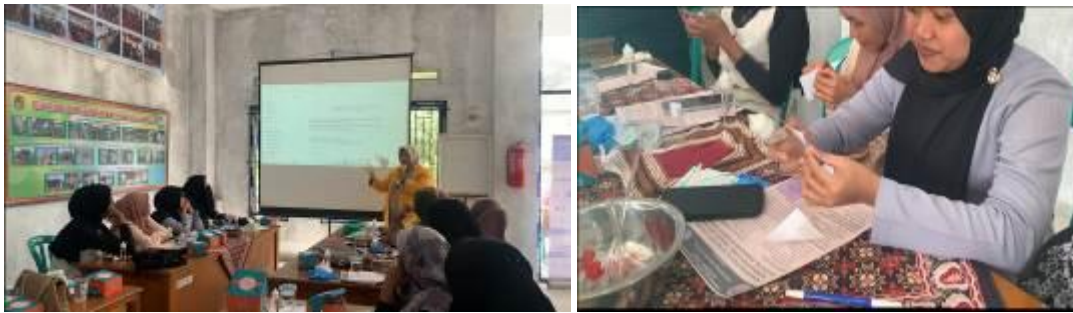
Gambar 5. Pemberian Materi Pelatihan Digital Brand Marketing (labeling)

minyak telon oil tetapi juga dapat dipasarkan untuk kemandirian ekonomi bagi kemajuan Nagari Gurun dapat dilihat pada gambar 4.