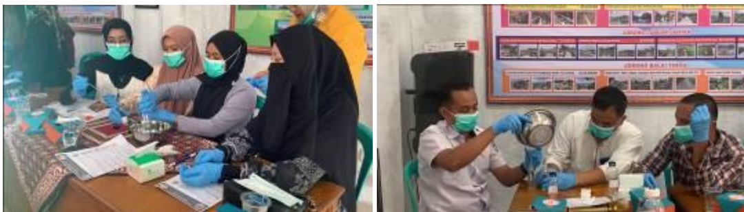
Gambar 4. Demonstrasi Pembuatan Inovasi Minyak Telon Sereh Wangi

Kegiatan selanjutnya praktek langsung Kelompok Tani Sukma Nusantara pembuatan minyak telon oil berbasis sereh wangi. Pemilihan sereh wangi sebagai bahan aktif dikarenakan pada penelitian sebelumnya yang menunjukkan bahwa kandungan minyak atsiri dapat dimanfaatkan sebagai aromaterapi (Al Fatina et al., 2021) dan pengharum multifungsi (Sari et al., 2024). Selain itu, (Yumhi et al., 2024) juga menggunakan sereh wangi sebagai bahan sabun, dan detergen. Melalui praktek langsung ini, kelompok tani tidak hanya mendapatkan pengetahuan dasar dalam membuat Optimalisasi produk sereh wangi melalui pelatihan digital brand marketing, inovasi telon oil, dan edukasi kesehatan untuk mewujudkan kemandirian ekonomi masyarakat gurun, Kabupaten Lima Puluh Kota