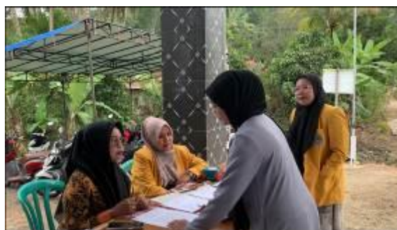
Gambar 1. Registrasi Peserta Pengabdian Masyarakat

Kegiatan pengabdian kepada masyarakat dilaksanakan di Nagari Gurun, Kecamatan Harau, Kabupaten Lima Puluh Kota, Provinsi Sumatera Barat pada bulan Juli hingga Agustus yang di hadiri oleh kelompok Tani Sukma Nusantara. Tujuan dari kegiatan pengabdian kepada masyarakat untuk meningkatkan keterampilan masyarakat dalam pemasaran digital, terbentuknya produk minyak telon berbasis sereh wangi yang siap di pasarkan serta meningkatnya kesadaran masyarakat akan manfaat produk herbal bagi kesehatan dan kecantikan.