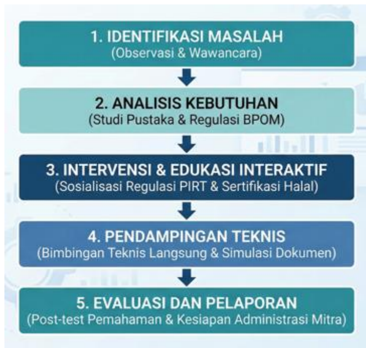
Gambar 1. Metode pelaksanaan

Pelaksanaan kegiatan pengabdian kepada masyarakat ini menggunakan pendekatan Participatory Action Research (PAR) , yang menempatkan pelaku UMKM di Kelurahan Griya Pinang Tangerang bukan sekadar sebagai objek, melainkan mitra aktif dalam proses identifikasi masalah dan pencarian solusi. Pendekatan PAR menekankan keterlibatan langsung masyarakat dalam setiap tahapan kegiatan, mulai dari identifikasi masalah, perencanaan, pelaksanaan hingga evaluasi tindakan secara kolaboratif (Sebuah et al., 2025). Dalam metode ini, masyarakat tidak hanya menjadi objek penelitian, tetapi juga berperan sebagai subjek yang memiliki peran setara dalam menghasilkan solusi atas permasalahan yang dihadapi (SIswandi & Syaifuddin, 2024). Selain itu, PAR banyak digunakan dalam kegiatan pengabdian masyarakat karena mampu meningkatkan pemberdayaan komunitas melalui partisipasi aktif, diskusi kelompok (focus group discussion), observasi, serta pendampingan secara berkelanjutan (Afni & Riani, 2024). Adapun tahapan pelaksanaan kegiatan ditunjukkan pada Gambar 1.