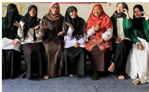
Gambar 3. Kegiatan Peningkatan Keterampilan Penyusunan RPP

Dengan demikian, RPP yang dihasilkan tidak hanya lebih lengkap secara administratif, tetapi juga lebih bermakna secara pedagogis. Adapun kegiatan peningkatan keterampilan penyusunan RPP dalam gambar berikut.