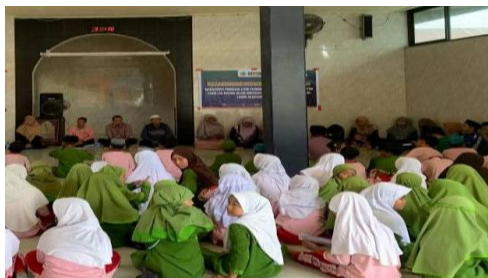
Gambar 2. Kegiatan Peningkatan Pemahaman Konseptual Guru

Perubahan sebagaimana dalam tabel di atas menunjukkan bahwa pelatihan tidak hanya meningkatkan pengetahuan, tetapi juga mengubah cara pandang ( mindset ) guru terhadap pembelajaran berbasis nilai. Adapun kegiatan peningkatan pemahaman konseptual guru dapat dilihat dalam gambar di bawah ini.