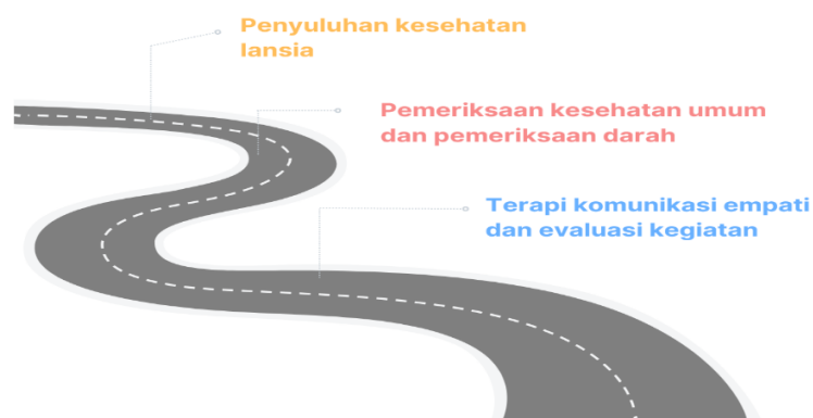
Gambar 1. Diagram Alur Pelaksanaan Pengabdian Kepada Masyarakat di Panti Werdha “Taat Twam Asi” Sentani