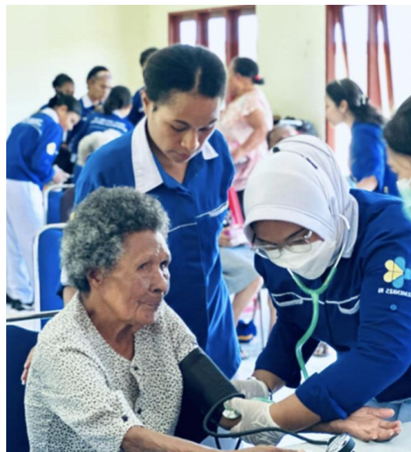
Gambar 4. Kegiatan Pemeriksaan Kesehatan di Panti Werdha Tresna "Taata Twam Asi" Sentani

Aspek psikologis pada gambar 1 menunjukkan bahwa sebelum intervensi penyuluhan terdapat 2 orang (6,5%) dengan kecemasan berat, 14 orang (45,2%) dengan kecemasan sedang, dan 15 orang (48,4%) dengan kecemasan ringan. Setelah intervensi pada gambar 2 menunjukkan tidak ditemukannya kategori berat dan distribusi berubah menjadi 26 orang (83,9%) kecemasan ringan dan 5 orang (16,1%)