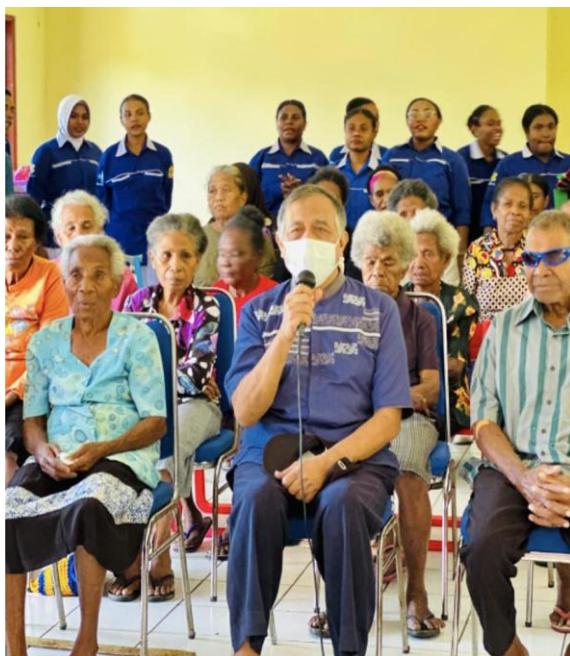
Gambar 3. Penyampaian Materi dan Diskusi di Panti Werdha Tresna "Taata Twam Asi" Sentani