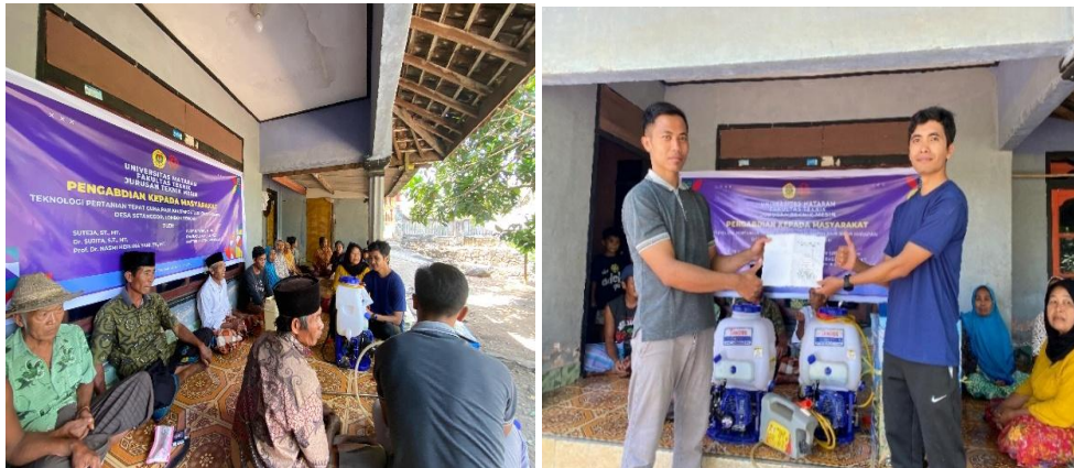
Gambar 5. Dokumentasi kegiatan pelatihan dan serah terima alat semprot kepada kelompok tani.

mulai dari pengaturan alat, teknik penggunaan yang baik dan aman, hingga bagaimana mengatasi kendala teknis yang mungkin muncul saat alat digunakan pada medan atau kondisi tanah tertentu.