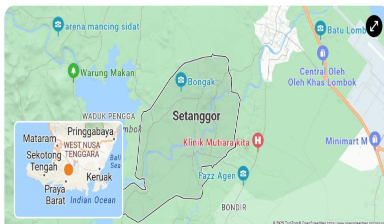
Gambar 1. Lokasi pengabdian pada kelompok tani sinar harapan.

Kegiatan pengabdian masyarakat oleh tim dari Teknik Mesin Universitas Mataram ini dilaksanakan pada kelompok tani sinar harapan di lingkungan Setanggor Timur 1, Desa Setanggor, Kec. Praya Barat, Lombok Tengah. Kegiatan Pengabdian ini dijalankan selama tiga bulan yaitu dari bulan Juni 2025 hingga Bulan Agustus 2025. Lokasi dari kelompok tani sinar harapan Desa Setanggor dapat dilihat pada gambar 1.