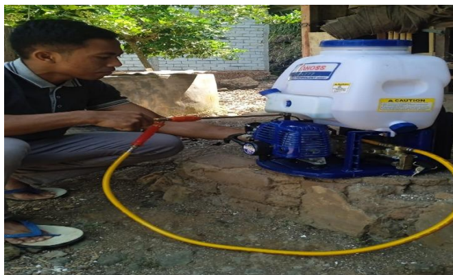
Gambar 4. Mesin semprot dan proses percobaan.

Kegiatan pengabdian kepada masyarakat di Kelompok Tani Sinar Harapan Desa Setanggor diawali dengan sosialisasi penggunaan alat semprot padi yang telah dipilih dan disesuaikan dengan kebutuhan serta kondisi lahan pertanian setempat. Dalam sesi sosialisasi ini, tim pengabdian memberikan penjelasan secara menyeluruh mengenai jenis dan fungsi alat yang akan diperkenalkan, mulai dari latar belakang pemilihan alat, keunggulan teknis dibandingkan alat tradisional, hingga dampaknya terhadap efisiensi kerja petani. Peserta sosialisasi yang terdiri dari anggota kelompok tani sangat antusias mengikuti penjelasan, karena selama ini mereka kerap menghadapi kendala klasik seperti keterbatasan waktu, tenaga, serta hasil tanam yang kurang optimal akibat penggunaan alat manual atau tradisional. Sosialisasi juga membahas tantangan pertanian masa kini, pentingnya inovasi, dan bagaimana teknologi sederhana dapat meningkatkan hasil panen sekaligus menekan biaya produksi.