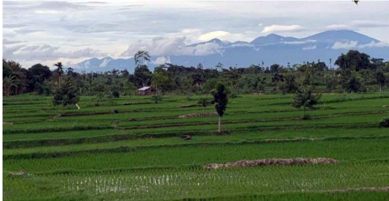
Gambar 2. foto lahan pertanian di Desa Setanggor.

Kegiatan pengabdian kepada ini dilakukan oleh Tim dosen Pelaksana Kegiatan PKM dan mahasiswa yang beranggotakan masing-masing 5 orang dan 1 orang dari Jurusan Teknik Mesin, Fakultas Teknik Universitas Mataram. Program Pengabdian ini dilakukan dengan metode penerapan teknologi pada masyarakat petani khususnya kelompok tani sinar harapan Desa Setanggor (Fathurrahim & Wahyuningsih, 2023). Kegiatan pengabdian terdiri dari beberapa tahap kegiatan mulai dari persiapan (diskusi dengan masyarakat) dan koordinasi kegiatan dari pembuatan dan pembelian alat hingga pelaksanaan kegiatan pelatihan penggunaan, pelatihan pengaplikasian serta kegiatan monitoring dan evaluasi yang keseluruhan memiliki keterkaitan masing-masing. Kegiatan awal berupa pembuatan desain dan perencanaan alat semprot (Gapsari et al., 2022; Hertanto et al., 2019). Desain mesin alat semprot dapat dilihat di gambar 3.