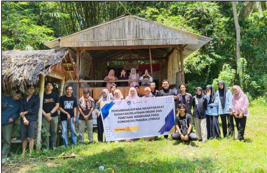
Gambar 6. Foto bersama setelah pelaksanaan kegiatan pengabdian kepada masyarakat

Faktor pendukung keberhasilan kegiatan meliputi keterlibatan aktif komunitas PULPEN (Gambar 6), pemanfaatan lingkungan lokal sebagai sumber belajar, serta penggunaan media pembelajaran visual dan kontekstual. Adapun kendala yang ditemui relatif terbatas, antara lain perbedaan latar belakang pengetahuan awal peserta dan keterbatasan waktu pelaksanaan. Namun demikian, kendala tersebut tidak secara signifikan menghambat pencapaian tujuan kegiatan, melainkan menjadi bahan evaluasi untuk pengembangan kegiatan serupa di masa mendatang.