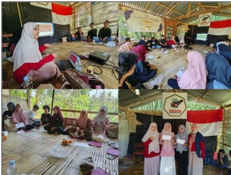
Gambar 3. Pemberian materi (indoor) dan pemberian hadiah badi peserta yang aktif

Implementasi solusi melalui kegiatan edukasi geologi yang mengintegrasikan penyampaian materi interaktif, observasi lapangan, dan pemanfaatan teknologi drone terbukti memberikan dampak positif terhadap peningkatan pemahaman peserta. Dalam kegiatan ini, peserta tidak hanya menerima materi secara teoritis, tetapi juga dilibatkan secara aktif dalam proses pembelajaran melalui diskusi, penggunaan media visual, serta pengamatan langsung terhadap jenis batuan dan bentuk bentang alam di sekitar Desa Padang. Pendekatan ini menjadikan konsep geologi yang sebelumnya bersifat abstrak menjadi lebih konkret, kontekstual, dan mudah dipahami (Gambar 3).