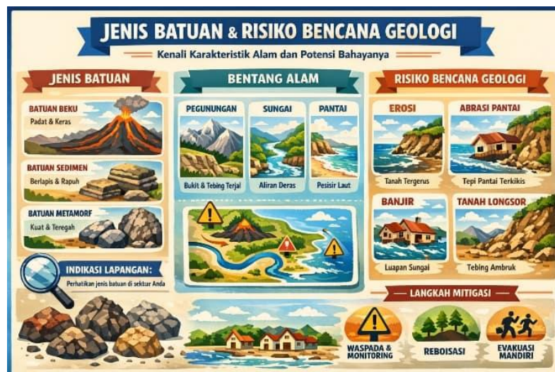
Gambar 5. Infografis edukasi bentuk bentang alam dan potensi bencana geologinya.

Luaran utama kegiatan pengabdian ini berupa leaflet dan infografis edukatif (Gambar 5) yang memuat informasi mengenai jenis batuan, karakteristik bentang alam, serta indikasi risiko bencana geologi seperti erosi, abrasi pantai, banjir, dan tanah longsor. Media edukasi tersebut dirancang secara sederhana dan visual agar mudah dipahami serta dapat dimanfaatkan secara berkelanjutan oleh mitra.