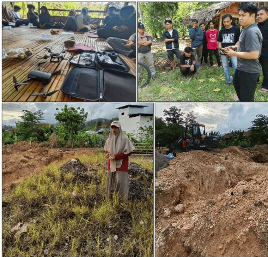
Gambar 4. Observasi lapangan dengan melihat batuan langsung di sekitar area sekitar dan melihat bentang alam secara luas dengan bantuan drone.

Meskipun drone dalam kegiatan ini digunakan sebagai media edukasi dan demonstrasi, bukan untuk akuisisi data lapangan secara langsung, penggunaannya tetap membantu peserta memahami hubungan antara bentang alam dan potensi bencana secara lebih kontekstual.