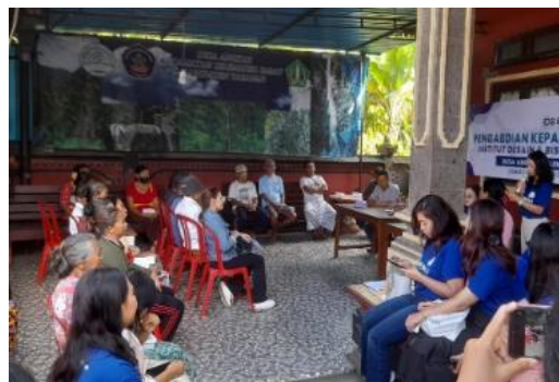
Gambar 4. FGD dengan Pihak Desa dan Masyarakat

Masukan ini menjadi dasar dalam merumuskan konsep desain yang tepat. Kolaborasi antara tim pengabdian, perangkat desa, dan pengguna berperan penting dalam memastikan bahwa rancangan yang dihasilkan memiliki keseimbangan antara aspek estetika dan fungsionalitas, sekaligus relevan dengan kebutuhan nyata pengguna (Santri et al., 2025). Dalam proses desain dengan mengimplementasikan pendekatan partisipatif dengan metode keterlibatan kolektif yang bersifat reflektif dan sistematis antara peneliti/desainer dan masyarakat sebagai mitra (Ibrahim Rahmani et al., 2023).