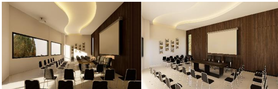
Gambar 6. Desain 3D Visual Gedung Pertemuan