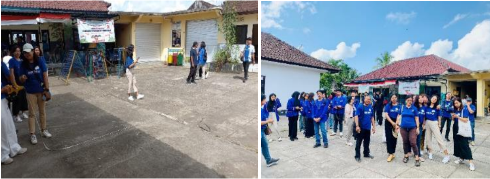
Gambar 3. Kegiatan Pengukuran Site