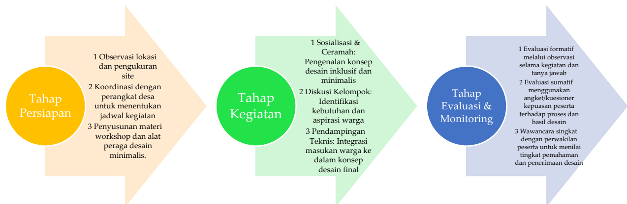
Gambar 1. Diagram Tahapan Pelaksanaan Kegiatan

Evaluasi dampak kegiatan dilakukan secara kombinasi kuantitatif mengukur tingkat kepuasan peserta terhadap proses partisipasi, pemahaman terhadap konsep desain inklusif, serta kesesuaian hasil desain dengan kebutuhan pengguna. Evaluasi dilakukan melalui observasi langsung dan wawancara semi-terstruktur dengan perangkat desa dan tokoh masyarakat sehingga dapat menilai relevansi desain terhadap kebutuhan nyata masyarakat. Tahapan kegiatan dapat dilihat pada Gambar 1.