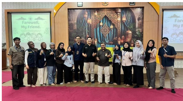
Gambar 1. Observasi dan Koordinasi Awal di KPP Pratama Pasuruan

Awal dimulai dengan observasi selama 5 hari kerja di KPP Pratama Pasuruan (Gambar 1). Observasi ini bertujuan untuk mengamati langsung alur pelayanan SPT Tahunan melalui Coretax, mencatat kendala yang sering dihadapi WP, serta mengidentifikasi profil WP yang mengalami kesulitan. Berdasarkan hasil observasi, ditemukan tiga masalah prioritas yang sering dihadapi WP OP saat menggunakan Coretax. Pertama, WP gagal melakukan aktivasi akun Coretax karena tidak memahami alur registrasi dan verifikasi data. Kedua, WP tidak memahami alur pelaporan SPT Tahunan melalui Coretax, terutama dalam mengisi bagian harta dan penghasilan tambahan. Ketiga, WP mengalami kesalahan teknis saat mengunggah bukti potong, yang menyebabkan SPT tidak dapat dikirimkan.