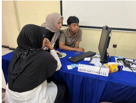
Gambar 4. Pendampingan Aktivasi Coretax di KPP Pratama Pasuruan

Kegiatan pendampingan aktivasi Coretax diutamakan kepada wajib pajak yang telah memiliki NPWP serta telah melakukan pemadanan Nomor Pokok Wajib Pajak (NPWP) dengan Nomor Induk Kependudukan (NIK) yang telah diatur dalam kebijakan terbaru DJP. Hal ini bertujuan untuk meminimalisasi kendala teknis dan administratif selama proses aktivasi.