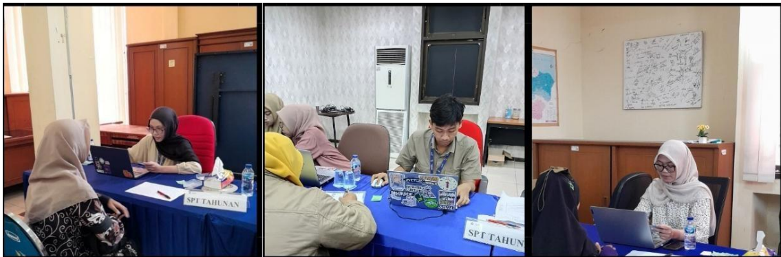
Gambar 2. Pendampingan Pelaporan SPT Tahunan Melalui Coretax di KPP Pratama Pasuruan

Untuk dapat melaporkan SPT secara online melalui Coretax, wajib pajak harus memiliki NPWP dan akun yang telah diaktivasi. Relawan pajak melakukan kegiatan pendampingan wajib pajak dalam pelaporan online, dimulai dengan login ke laman Coretax, memilih menu Laporan, lalu menggunakan fitur pelaporan SPT untuk mulai menyampaikan SPT Tahunan secara elektronik.