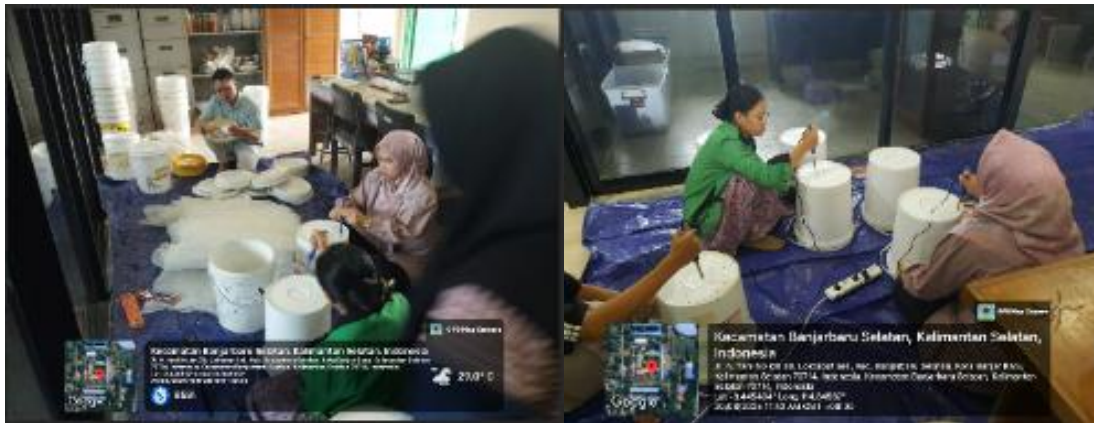
Gambar 2. Pembuatan ember tumpuk oleh tim pengabdian

Gambaran IPTEKS yang diimplementasikan pada mitra sasaran berupa teknologi ember tumpuk untuk pengolahan sampah organik rumah tangga menjadi POC disajikan pada Gambar 1. Teknologi ini bersifat sederhana, murah, dan dapat diaplikasikan oleh masyarakat secara mandiri di tingkat rumah tangga. Setelah pembuatan ember tumpuk (Gambar 2), tim pengabdian yang terdiri dari dosen dan mahasiswa kemudian membuat kompos dan POC sebagai sampel untuk pelatihan dengan metode ember tumpuk (Gambar 3).