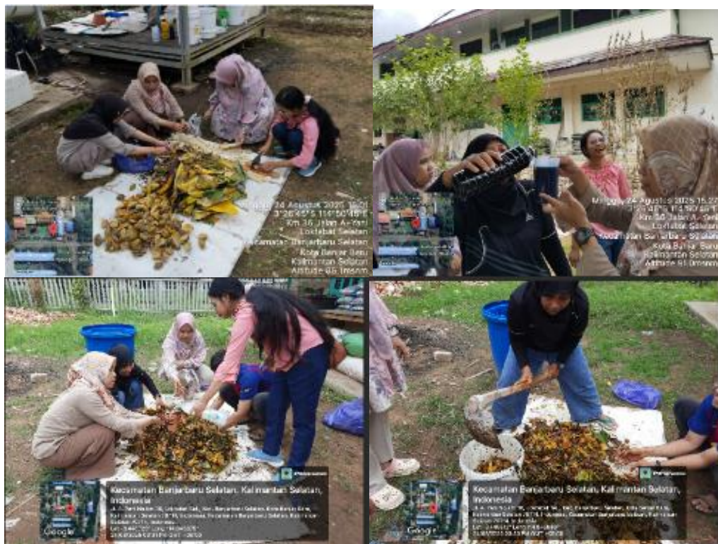
Gambar 3. Pembuatan POC dan kompos sebagai sampel oleh tim pengabdian

Kegiatan pelatihan dilaksanakan setelah ember tumpuk dan sampel POC dan kompos selesai dibuat. Kegiatan pelatihan pembuatan POC dengan metode ember tumpuk dilaksanakan pada hari Jumat, tanggal 6 September 2025 di depan rumah ketua kelompok Dasa Wisma Teratai 8 (Gambar 4). Pelatihan diawali dengan pemberian materi tentang pupuk organik dan anorganik, praktek pencampuran sampah dengan bioaktivator EM 4 , pengomposan dalam ember tumpuk, dan diakhiri dengan sesi foto bersama (Gambar 4). Hasil pendataan terhadap kegiatan PkM terhadap kelompok Dasa Wisma Teratai 8 menunjukkan bahwa masyarakat sangat antusias dalam mengikutinya. Jumlah