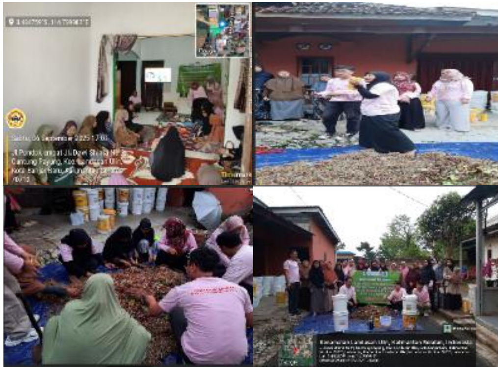
Gambar 4. Pelatihan pembuatan kompos dan POC dengan metode ember tumpang

peserta yang mengikuti pelatihan ada 25 orang dan semuanya adalah perempuan (Tabel 2). Berdasarkan umur, jumlah peserta yang mengikuti pelatihan 44% telah berumur >45 tahun (Tabel 2). Tingkat pendidikan peserta pelatihan bervariasi dari SD hingga Strata 2, dimana >52% pendidikannya minimal SMA sederajat (Tabel 2). Pekerjaan peserta pelatihan beragam dan 76% adalah ibu rumah tangga (Tabel 2).