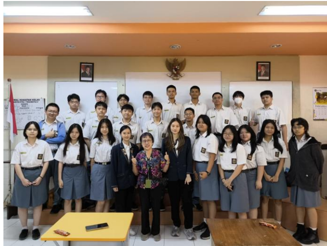
Gambar 5. Foto bersama

sesi foto bersama dengan tim, guru pendamping, dan seluruh peserta sebagai dokumentasi pelaksanaan kegiatan pengabdian masyarakat, sebagaimana ditunjukkan pada Gambar 5.