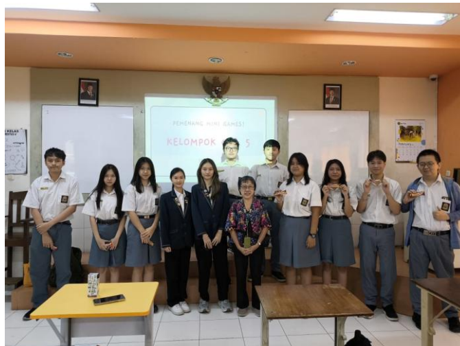
Gambar 4. Pembagian hadiah