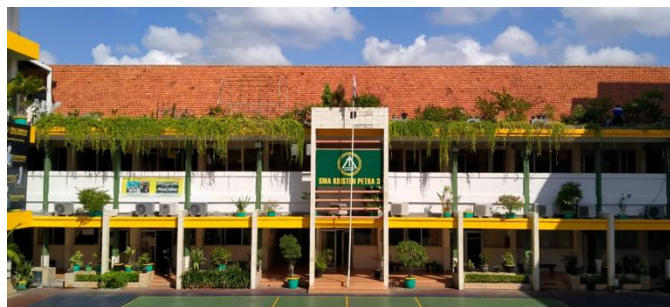
Gambar 2. SMA Kristen Petra 3 Surabaya

Kegiatan pengabdian kepada masyarakat ini dilaksanakan di SMA Kristen Petra 3 Surabaya dengan sasaran siswa kelas XI. Kegiatan difokuskan pada peningkatan pemahaman siswa mengenai dasar-dasar investasi, jenis-jenis investasi, konsep risiko investasi dan imbal hasil investasi, serta pengenalan fintech sebagai bagian dari sistem keuangan modern. Melalui pendekatan service learning yang bersifat interaktif, siswa tidak hanya memperoleh materi pembelajaran, tetapi juga berpartisipasi secara aktif dalam kegiatan diskusi serta evaluasi pembelajaran. Berdasarkan latar belakang yang telah dipaparkan, kegiatan ini dilaksanakan dengan tujuan untuk meningkatkan tingkat literasi keuangan siswa Sekolah Menengah Atas (SMA), khususnya terkait pemahaman mengenai investasi dan financial technology (fintech). Selain itu, kegiatan ini juga bertujuan untuk mendukung terbentuknya kemampuan siswa dalam mengambil keputusan keuangan secara lebih bijaksana, rasional, dan sesuai dengan perkembangan era digital.