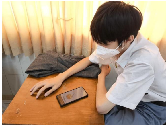
Gambar 4. Siswa mengerjakan pertanyaan evaluasi

Tabel 1 menunjukkan hasil penilaian kegiatan pengabdian masyarakat yang diikuti oleh 23 responden, menggunakan rentang nilai 1 sampai 4. nilai 1 menunjukkan sangat tidak setuju, nilai 2 tidak setuju, nilai 3 setuju, dan nilai 4 sangat setuju. Berdasarkan hasil pengukuran, rata-rata penilaian tertinggi terdapat pada aspek kegiatan menambah wawasan, kesesuaian waktu kegiatan, serta kepuasan peserta mengikuti acara dengan skor rata-rata sebesar 4. Selain itu, aspek penggunaan materi serta relevansi kegiatan juga memperoleh nilai yang relatif tinggi dengan rata-rata skor 4. Sementara itu, beberapa aspek seperti kegiatan berjalan monoton dan kurang menarik serta kesiapan kegiatan mendapatkan nilai lebih rendah, masing-masing dengan rata-rata skor 2 dan 3. Aspek pembinaan yang kurang profesional memperoleh nilai terendah yaitu 1. Secara keseluruhan, hasil ini menunjukkan bahwa kegiatan telah memberikan manfaat yang baik bagi peserta, terutama dalam menambah wawasan dan kepuasan mengikuti acara, meskipun masih terdapat beberapa hal yang perlu diperbaiki untuk meningkatkan kualitas pelaksanaan kegiatan di masa mendatang.