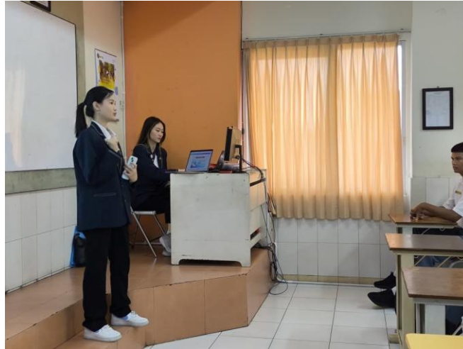
Gambar 3. Penyampaian materi