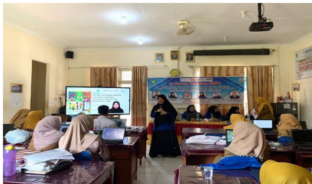
Gambar 2. Penyampaian Materi Edukasi Kesehatan Holistik kepada Guru SMA Negeri 2 Banyuasin 1

Pada tahap pelaksanaan kegiatan, materi disampaikan melalui ceramah interaktif, diskusi, dan sharing session bersama peserta. Penyampaian materi dilakukan secara kontekstual dengan mengaitkan topik kesehatan fisik, mental, sosial, dan psikososial remaja dengan pengalaman guru selama proses pembelajaran di kelas. Selama kegiatan berlangsung, peserta menunjukkan antusiasme yang tinggi, terutama pada sesi diskusi dan refleksi bersama. Banyak guru menyampaikan bahwa permasalahan kesehatan siswa sering kali berdampak langsung terhadap konsentrasi belajar, motivasi, kedisiplinan, serta interaksi sosial siswa di sekolah. Dokumentasi kegiatan penyampaian materi edukasi kesehatan holistik dapat dilihat pada Gambar 2.