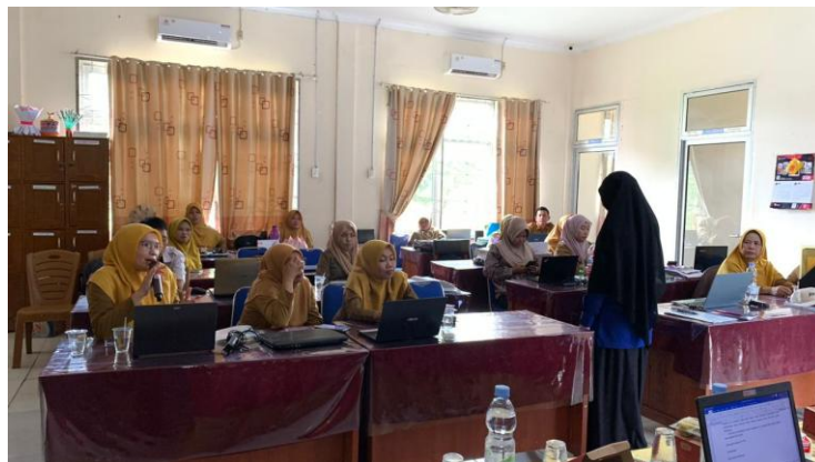
Gambar 4. Sesi Tanya Jawab dan Refleksi Peserta

Selain itu, peserta juga memberikan respons positif terhadap strategi sederhana yang dapat diterapkan dalam pembelajaran sehari-hari, seperti refleksi singkat sebelum pembelajaran, diskusi ringan mengenai pola hidup sehat, dan pembiasaan sederhana untuk meningkatkan kesadaran kesehatan siswa. Strategi tersebut dinilai mudah diterapkan tanpa harus menambah jam pelajaran atau mengubah kurikulum sekolah. Pada sesi tanya jawab dan refleksi, peserta menyampaikan berbagai gagasan implementasi yang dapat diterapkan sesuai dengan karakteristik mata pelajaran masing-masing. Dokumentasi sesi ini ditampilkan pada Gambar 4.