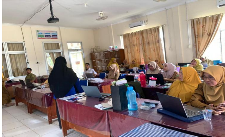
Gambar 3. Diskusi dan Sharing Session Bersama Peserta

Selama kegiatan berlangsung, peserta menunjukkan keterlibatan yang baik, terutama pada sesi diskusi dan sharing session. Banyak guru menyampaikan bahwa permasalahan kesehatan siswa sering kali berdampak langsung terhadap konsentrasi belajar, motivasi, kedisiplinan, serta interaksi sosial siswa di sekolah. Melalui diskusi yang dilakukan, peserta juga berbagi pengalaman mengenai berbagai tantangan yang dihadapi dalam mendampingi siswa yang mengalami masalah kesehatan fisik maupun mental. Suasana diskusi dan sharing session bersama peserta ditunjukkan pada Gambar 3.