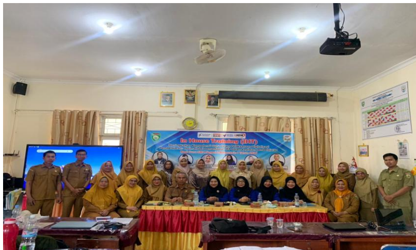
Gambar 5. Foto Bersama Tim Pengabdian dan Peserta Kegiatan

Selama pelaksanaan kegiatan terdapat beberapa kendala, seperti keterbatasan waktu kegiatan dan perbedaan tingkat pemahaman peserta mengenai kesehatan mental dan psikososial remaja. Selain itu, masih terdapat anggapan bahwa pendidikan kesehatan hanya menjadi tanggung jawab guru tertentu, seperti guru Biologi atau guru Bimbingan dan Konseling. Oleh karena itu, diperlukan kolaborasi antar guru dan dukungan sekolah untuk membangun budaya hidup sehat yang dapat diterapkan secara konsisten dalam lingkungan pembelajaran. Kegiatan pengabdian diakhiri dengan sesi penutupan dan dokumentasi bersama seluruh peserta yang ditunjukkan pada Gambar 5.