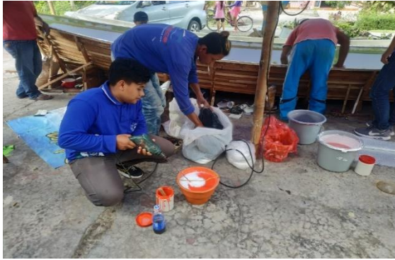
Gambar 4. Kegiatan persiapan pembuatan perahu fiberglass