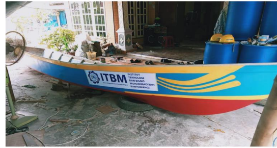
Gambar 1. Hasil pembuatan kapal berbahan Fiberglass Reinforced Plastics (FRP),

Kegiatan akhir dari kegiatan pengabdian ini adalah evaluasi. Evaluasi dilakukan guna melihat pencapaian akhir dari kegiatan pembuatan kapal. Antusiasme peserta dan hasil akhir pembuatan kapal adalah bahan pertimbangan dari evaluasi. Pembuatan kapal yang dilakukan juga menunjukkan hasil yang baik. Pembuatan kapal berbahan fiberglass dibutuhkan pengetahuan tentang design dan bahan yang digunakan yaitu Fiberglass Reinforced Plastics (FRP).