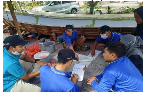
Gambar 3. Kegiatan penyampaian materi pembuatan perahu Fiberglass

Kegiatan awal yang dilakukan adalah pelatihan. Pelatihan dimaksudkan untuk memberikan transfer teknologi pembuatan kapal berbahan fiberglass yang telah didesain sebelumnya. Materi yang disampaikan dapat membuka wawasan tentang design kapal dan bagian-bagian kapal, pengenalan Fiberglass Reinforced Plastics (FRP), komposisi bahan baku yang digunakan, dan metode pembuatan kapal dengan metode hand lay-up .