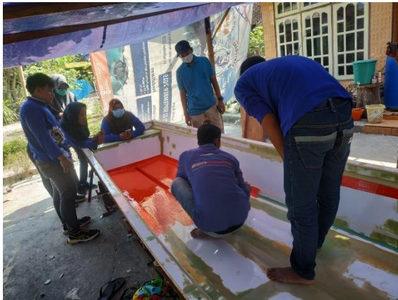
Gambar 5. Pelapisan cetakan ( mold ) dengan menggunakan mirror glaze

Kegiatan kedua dilakukan pendampingan. Pendampingan dilakukan secara langsung pada saat pembuatan kapal. Kegiatan pendampingan yang dilakukan antara lain pelapisan mould dengan mirror glaze , pelapisan dengan menggunakan gelcoat , pembuatan lambung kapal dengan metode hand lay-up sampai dengan pelepasan kapal dari cetakan ( mold ). Selain itu tahap finishing pengecatan dan pemasangan stiker juga dilakukan.