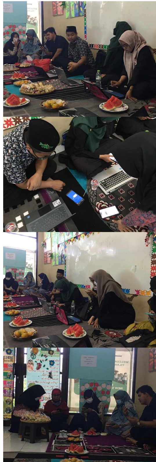
Gambar 3. Pelaksanaan Praktik Media Edmodo

Tahap berikutnya adalah praktik dalam membuat akun Edmodo dan penggunaannya. Pada tahap ini peserta dapat melakukan praktik dengan menggunakan laptop maupun handphone. Berikut adalah dokumentasi sesi praktik.