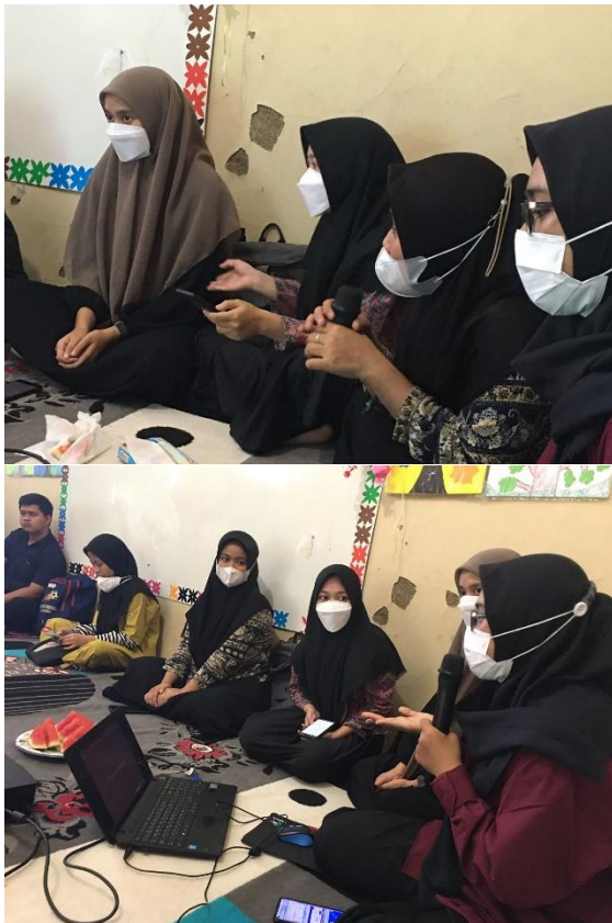
Gambar 4. Tanya jawab dan diskusi antara peserta pelatihan dan tim PKM

Kegiatan PKM ini ditutup dengan menyebarkan angket kepada peserta pelatihan yang bertujuan untuk memberikan evaluasi terhadap proses pelatihan. Hasil dari PKM ini adalah guru sangat tertarik dan aktif dalam mengikuti pelatihan ini, karena Edmodo dapat membantu mereka dalam proses kegiatan belajar mengajar sehingga membuat pembelajaran menjadi lebih menyenangkan karena dapat belajar dimanapun dan kapanpun. Hal ini sejalan dengan Puspitaloka, N., dkk (2018) dalam penelitiannya yang berjudul: "Edmodo as Educational Social Network in Teaching Course Design of EYL". Mereka mengatakan bahwa Edmodo dapat meningkatkan meningkatkan kemampuan mahasiswa pada mata kuliah Course Design of EYL , selain itu juga Edmodo dapat membantu mahasiswa untuk lebih memahami materi pembelajaran karena mahasiswa dapat berdiskusi dan belajar dimanapun dan kapanpun sehingga mereka menjadi lebih aktif, tertarik dan senang ketika belajar dengan menggunakan media Edmodo.