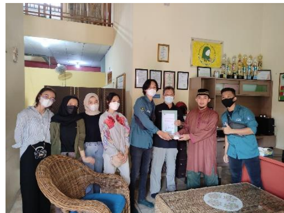
Gambar 5. Penyerahan Simbolis paket Nasi Pahlawan kepada pengurus Graha Anak Yatim dan Dhuafa