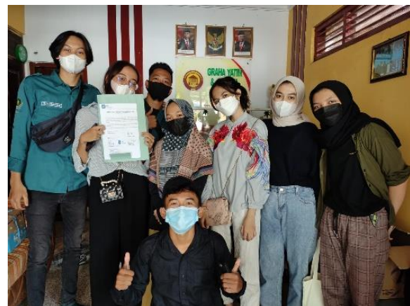
Gambar 6. Beberapa mahasiswa HIMABIS yang terlibat dalam kegiatan.