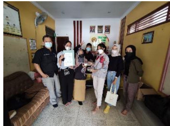
Gambar 4. Penyerahan Simbolis Nasi Pahlawan