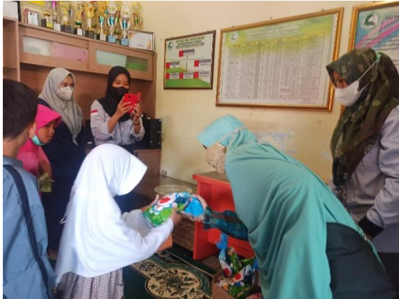
Gambar 7. Penyerahan Simbolis Nasi Pahlawan kepada Anak Yatim