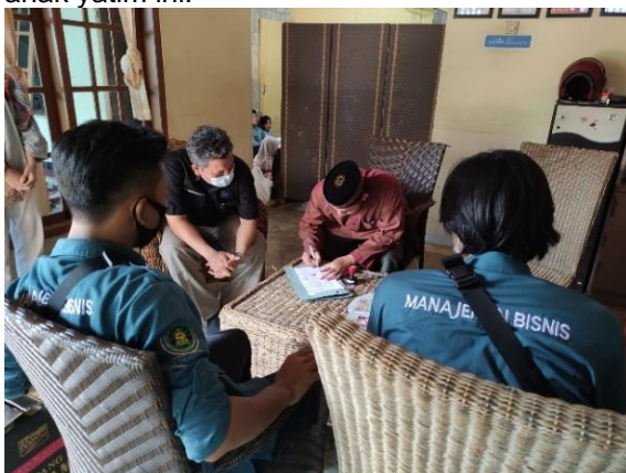
Gambar 3. Penerimaan BAKSOS dari GRAY

Kegiatan selanjutnya pemberangkatan ke area tujuan. Untuk HIMABIS dilakukan di GRAY. Disana penerimaan disambut oleh perwakilan dari Graha Anak Yatim dan Dhuafa, terlihat seperti pada Gambar 3. Kegiatan selanjutnya adalah penyerahan 120 box paket Nasi Pahlawan untuk anak-anak yatim serta masyarakat yang menjadi pahlawan bagi anak-anak yatim ini.