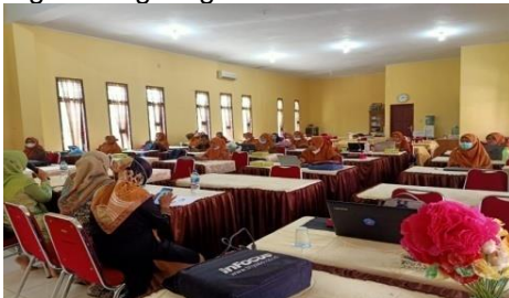
Gambar 1. Kondisi pada saat berlangsungnya kegiatan penyampaian materi pelatihan

Sosialisasi penulisan artikel ilmiah bagi guru dianggap perlu dilakukan mengingat kewajiban guru untuk mengusulkan kenaikan pangkat salah satunya adalah menghasilkan karya ilmiah sebagai bukti pengembangan diri guna memenuhi angka kredit guru. Output dari sosialisasi di sesi pertama ini dapat dilihat dari gambar di bawah ini, dimana peserta menunjukkan perilaku yang sangat kondusif, artinya para peserta memberikan perhatian dan menyimak pemaparan materi yang disampaikan, perilaku lain yang ditunjukkan adalah peserta mengajukan pertanyaan disaat ada materi yang kurang jelas. Gambar 1 menunjukkan keadaan saat pemberian materi sedang berlangsung.