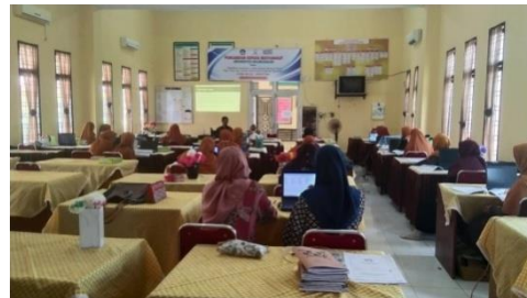
Gambar 2. Peserta mengikuti pelatihan teknik submission pada jurnal nasional

Kondisi pelaksanaan pelatihan teknik submission artikel dapat dilihat pada gambar 2 berikut ini.