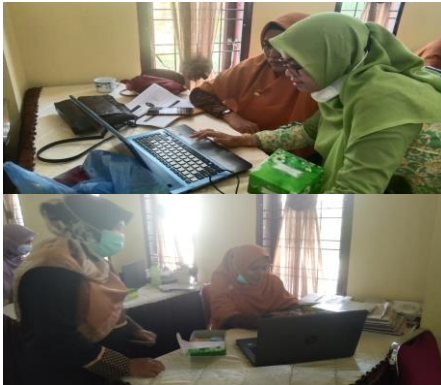
Gambar 3. Tim pengabdian membimbing secara langsung peserta pelatihan

memanggil tim pengabdian agar dibantu secara langsung. Tim pengabdian juga mengarahkan secara langsung guru – guru yang sedang melakukan pelatihan, kondisi arahan langsung tim dapat dilihat pada gambar 3 berikut.