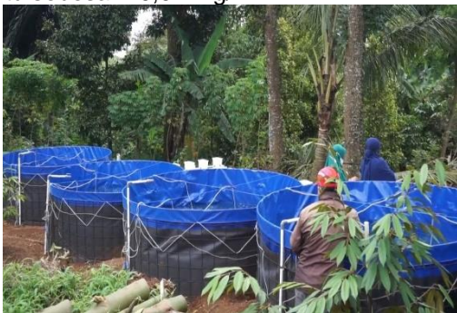
Gambar 2. Unit Bioflok-Akuaponik yang Dibangun

Pengembangannya melalui penggabungan keduanya yaitu sistem akuakultur dan hidroponik dan dilakukan penambahan sistem filter pada rangkaian akuaponik, sehingga dengan kondisi tersebut akan mengontrol produksi amoniak dalam kolam. Hal ini sesuai hasil penelitian (Dewi et al., 2020b) yang menyatakan kandungan amoniak rata-rata 0,016 mg/L, yang diartikan kandungan amonia dalam kolam masih di bawah baku mutu. Kondisi ini dapat terjadi karena adanya bakteri yang dapat memecah limbah dari ikan, yaitu bakteri Nitrosomonas, yang mengubah Amonia menjadi Nitrit, Nitrit kemudian diubah menjadi Nitrat oleh bakteri Nitrobacter. Menurut persyaratan SNI 7550: 2009, batas maksimum kadar amonia untuk kegiatan budidaya ikan yaitu sebesar <0,02 mg/L.