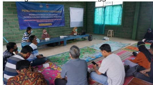
Gambar 1. Penyuluhan tentang Sistem Bioflok-Akuaponik, Budidaya Ikan dan Tanaman

Sistem Bioflok-Akuaponik merupakan suatu sistem budidaya ikan dan tanaman yang telah dikembangkan, telah diteliti melalui pendanaan Direktorat Riset dan Pengabdian Masyarakat, Direktorat Jendral Penguatan Riset dan Pengembangan Kementerian Riset, Teknologi dan Pendidikan Tinggi.