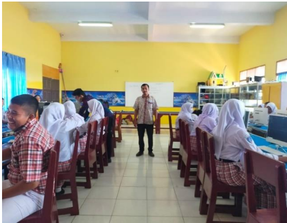
Gambar 3. Penjelasan Editing Video

Pada tahap ini tim PKM akan melakukan pendampingan selama 2 hari, dalam pelaksanaan pendampingan ini dilakukan untuk merespon pertanyaan dari peserta pelatihan dan mengukur sejauh mana pemahaman peserta pelatihan setelah menggunakan metode ceramah dan praktek yang dilakukan oleh tim pengabdian, serta Bersama-sama melakukan dialog mengenai cara penggunaan aplikasi wondershare filmora 9.