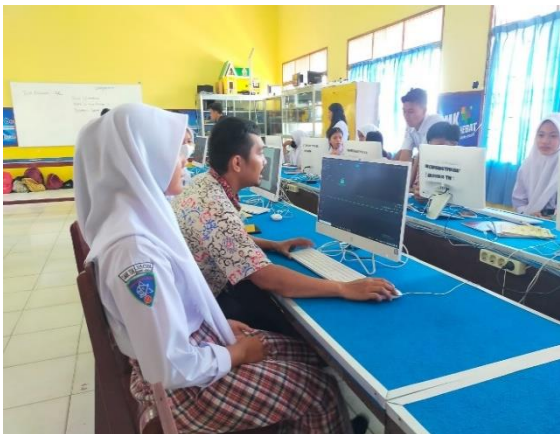
Gambar 4. Praktek Editing Video