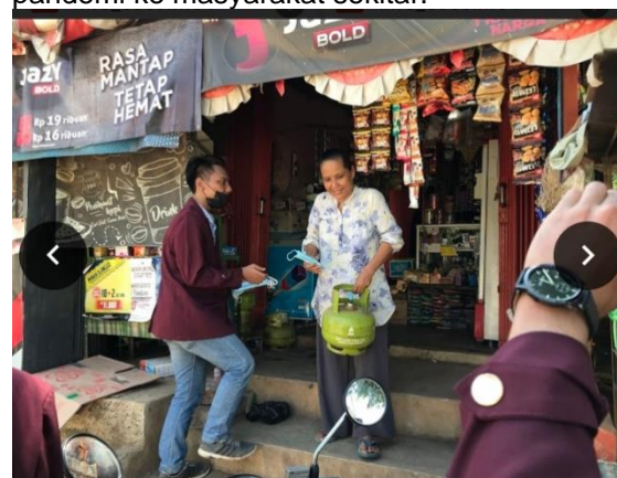
Gambar 4. Kegiatan Pemberian Masker kepada masyarakat Desa Klari.

hidung atau mulut. Hasil Kuliah Kerja Nyata (KKN) yang diadakan di desa klari kecamatan klari adalah sebagai berikut. Penduduk menerima masker gratis, desa menerima masker, dan beberapa lokakarya memungkinkan anak-anak sekolah dan siswa untuk belajar lebih banyak tentang polusi udara dan kapan dan apa yang terjadi Kali ini, SD Negeri Klari 1, penulis memiliki beberapa tanaman untuk meningkatkan kadar oksigen di lingkungan sekolah. Usai kegiatan ini, pembagian masker kepada masyarakat sekitar, dan diskusi dilakukan di SD Negeri Klari 1. Kegiatan selanjutnya adalah membagikan masker kepada masyarakat sekitar untuk mencegah penyebaran penyakit di masa pandemi ke masyarakat sekitar.