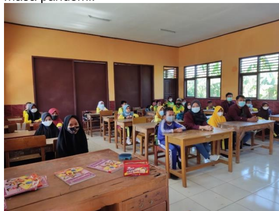
Gambar 1. Sosialisasi Pentingnya Penggunaan Masker di SD Negeri Klari 1. (Sumber : Muhamad Hamzah Saefulloh, 2021).

di Desa Klari bagi mahasiswa S1 dan siswa yang belajar di SD Negeri Klari 1 untuk mencegah pencemaran udara. , pentingnya cuci tangan, dampak polusi udara, kesehatan masyarakat untuk mencegah terjadinya penyebaran penyakit di masa pandemi. Bagian Sosialisasi mengedukasi dan mensosialisasikan tahapan-tahapan kegiatan yang dilakukan sehubungan dengan pentingnya penggunaan masker di Desa Klari bagi mahasiswa S1 dan siswa yang belajar di SD Negeri Klari 1 untuk mencegah pencemaran udara, pentingnya cuci tangan, memakai masker, kesehatan masyarakat untuk mencegah terjadinya penyebaran penyakit di masa pandemi.