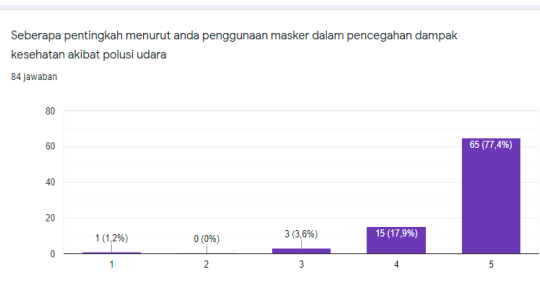
Gambar 2. Kuisisioner Pentingnya Penggunaan Masker di Desa Klari

Hasil rekapitulasi kuisisioner yang telah diperoleh dan dijelaskan dalam gambar berikut ini: