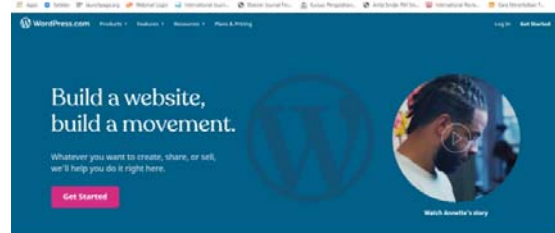
Gambar 4. Login Pada www.wordpress.com .

Pengguna situs Wordpress dapat melakukan pendaftaran dan langsung memiliki situs tanpa perlu berhubungan dengan bahasa pemrograman web . Buka web browser arahkan URL ke http://wordpress.com . URL Wordpress berbahasa Indonesia http://id.wordpress.com (Gambar 3). Ada beberapa tema WordPress gratis dan premium (memiliki fitur berbayar).