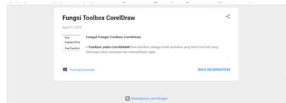
Gambar 10. Tampilan Link https://designgrafik55.blogspot.com/?m=1