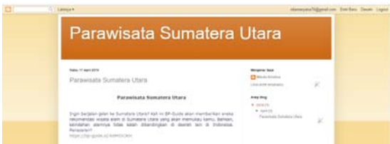
Gambar 3. Materi Workshop

Pelatihan dimulai dengan pengarahan dari pihak sekolah mengenai maksud dan tujuan pelaksanaan berbentuk workshop. Tim pelaksana pengabdian mempersiapkan materi dalam bentuk foto copy dan pemaparan dengan slide. Instruktur/moderator pelaksanaan pelatihan yaitu Anita Sinder RMS, ST., MTI. Alat pembelajaran terdiri dari infokus dan perangkat komputer. Pada akhir sesion workshop, masing-masing siswa mengirimkan link blog yang sudah dibuat.berberpa siswa menampilkan hasil blog.