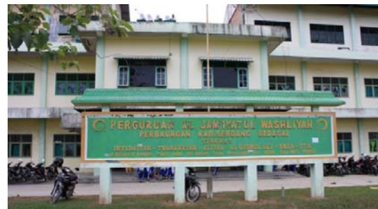
Gambar 1. SMA AL Washliyah 12 Perbaungan

Pembelajaran bentuk workshop merupakan satu alternatif dalam mendesain model-model atau metode-metode serta strategi pembelajaran yang merupakan salah satu elemen dari unsur utama dalam mendesain pembelajaran. Workshop dapat mengubah paradigma pembelajaran dari teacher centered menuju student centered .