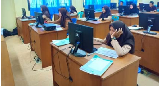
Gambar 2. Ruang Praktek Komputer

Materi pelatihan pembuatan blog terdiri dari pengertian Blog , Blogger , penjelasan blogger , penjelasan Wordpres , membuat blog di web hosting , membuat blog di blogger.com , membuat blog di Wordpress .