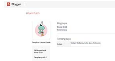
Gambar 8. Profil Blogger Pada Blogspot

email dan password Gmail. Menampilkan informasi pribadi pada blog yaitu berikan tanda centang pada kotak Nama, Uraian, Lokasi, Kota/Provinsi, Gambar 7.