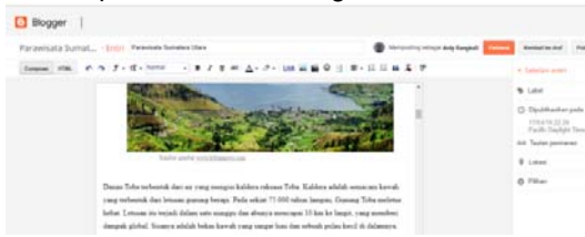
Gambar 6. Pembuatan Blog Baru

Langkah selanjutnya Klik Blog baru - masukkan nama blog - pilih alamat blog, atau url - pilih template - klik buat blog.