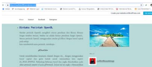
Gambar 7. Memasang Avatar Pada Wordpress

Untuk memasang avatar, Gambar 6, buka menu Users -> Your Profile. Pada bagian My Picture, klik Browse dan Upload Image. Tunggulah beberapa saat akan diminta crop (memotong) gambar, tipe gambar yang dapat digunakan sebagai avatar adalah JPG, GIF, atau PNG.