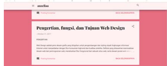
Gambar 9. Tampilan Link https://anzelia22.blogspot.com/