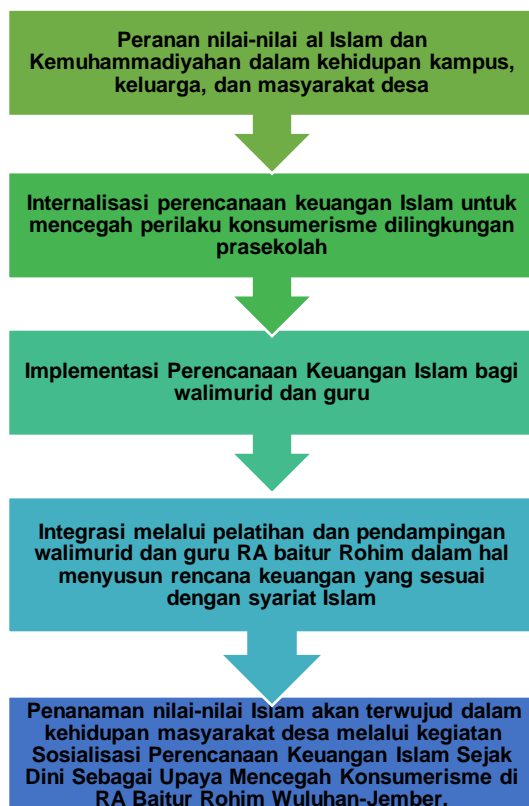
Gambar 1. Alur Kegiatan

Diskusi dan umpan balik sangat penting dilakukan dalam kegiatan ini. Selain untuk mengukur tingkat pemahaman peserta PKM juga dapat mengetahui sejauh mana hasil akhir dari kegiatan ini apakah perlu dilakukan ulang mulai tahap awal atau kah sebagian tahapan saja. Adapun alur dari pelatihan ini secara keseluruhan terlihat pada Gambar 1.