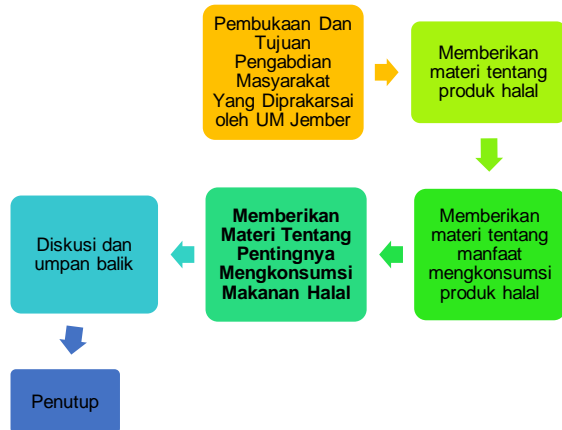
Gambar 2. Rincian kegiatan.

secara Islami. Pada sesi terakhir, para wali murid akan diberikan waktu untuk berdiskusi seputar materi yang telah disampaikan dan umpan balik atas kegiatan PKM ini, hal ini bertujuan untuk mengukur keberhasilan dan dimungkinkan adanya pengulangan ada tahap tertentu. Untuk lebih jelasnya dapat dilihat pada Gambar 2.