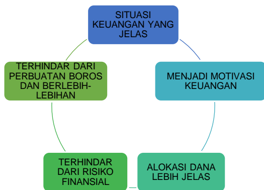
Gambar 3. Manfaat Perencanaan Keuangan.

Sesi ini membahas tentang pentingnya membuat perencanaan keuangan pada setiap individu khususnya keluarga dari siswa. Ada beberapa manfaat yang akan diperoleh dari perencanaan keuangan yaitu: