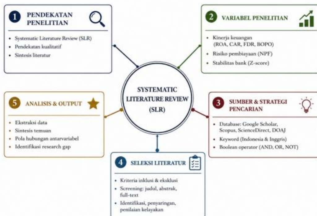
Gambar 1. Systematic Literature Review

Gambar 1 menjelaskan bahwa keseluruhan kata kunci dan variabel penelitian yang dirumuskan dalam kerangka Systematic Literature Review (SLR) mencerminkan suatu proses analisis yang sistematis, terstruktur, dan komprehensif dalam mengkaji stabilitas bank syariah. Pendekatan ini mengintegrasikan berbagai variabel utama, meliputi kinerja keuangan yang terdiri atas profitabilitas, likuiditas, efisiensi operasional, dan permodalan, serta