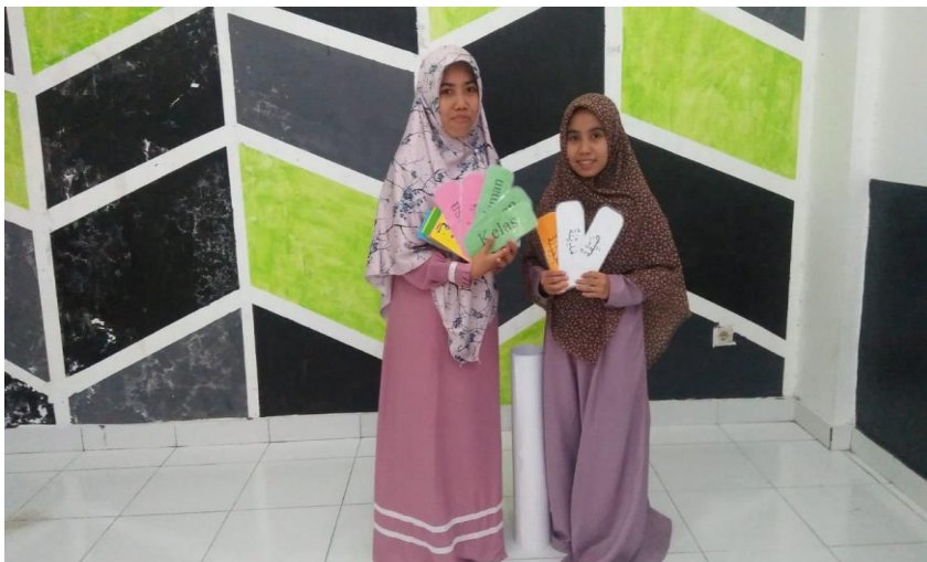
Gambar 3. Hasil pembuatan media pembelajaran.