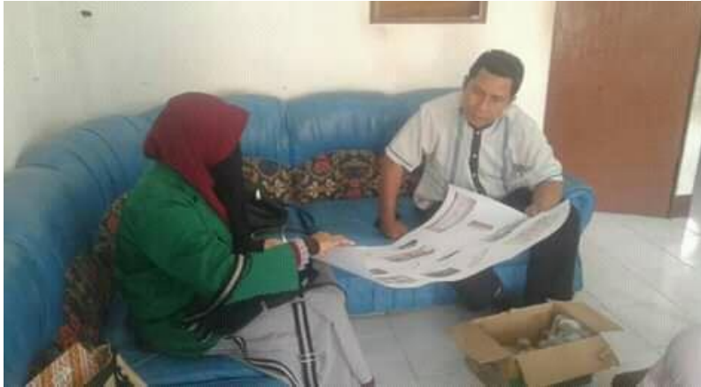
Gambar 2. pemberian pemahaman kepada guru bahasa Arab terkait media pembelajaran bahasa Arab.

media pembelajaran bahasa Arab, serta membuat dan mengembangkan media pembelajaran.