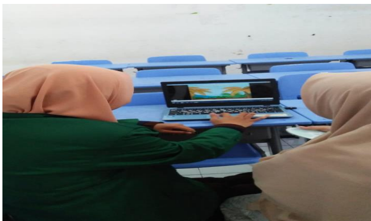
Gambar 1. Tahapan persiapan kegiatan

Persiapan kegiatan dilaksanakan dengan melakukan observasi pada sekolah mitra, dan melakukan wawancara terkait media pembelajaran dan pengembangannya.