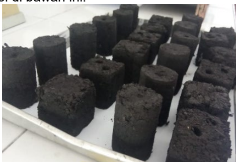
Gambar 2. Briket Eceng Gondok

Adapun bentuk briket dan data yang dihasilkan seperti terlihat pada gambar dan tabel di bawah ini.