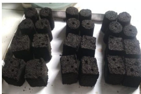
Gambar3. Briket Abu Sekam Padi