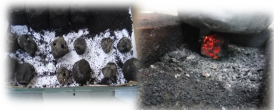
Gambar 4. Proses Pembakaran briket hingga mencapai suhu maksimum

Hasil penelitian penelitian pada Tabel 2 dan 3 terlihat bahwa terdapat hubungan yang sangat signifikan antara bahan dasar, geometri, dan tekanan pembentukan pellet-peletBriket dengan bentuk silinder memiliki karakteristik lebih mudah menyala daripada briket berbentuk kotak karena jika ditata sejajar briket bentuk silinder memiliki ruang lebih banyak untuk oksigen (Asri & Indrawati, 2018).Laju pembakaran briket menjadi lebih tinggi pada kecepatan aliran udara yang lebih tinggi. Kecepatan udara yang lebih besar memberikan supply oksigen yang lebih besar juga. Laju perambatan pembakaran sebanding dengan peningkatan kecepatan aliran suplai oksigen (Aljarwi et al., 2020). Semakin luas area yang dilalui oleh oksigen maka kecepatan pembakaran akan semakin meningkat.