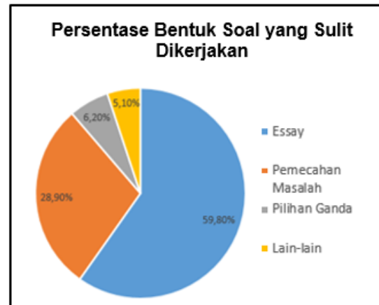
Gambar 2. Persentase bentuk soal yang sulit dikerjakan

Kesulitan terbesar yang dialami siswa dalam belajar fisika yaitu menentukan rumus yang digunakan ketika menyelesaikan soal. Pada umumnya siswa jarang melakukan analisis soal dan sekadar menebak dan menghafal rumus pada contoh soal yang diberikan guru, sehingga siswa akan mengalami kesulitan apabila disajikan soal dengan permasalahan yang lebih kompleks (Azizah et al. , 2015). Berikut adalah persentase macam-macam bentuk soal yang sulit dikerjakan menurut siswa.