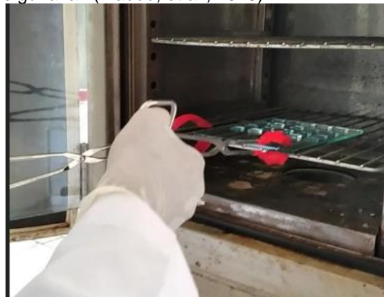
Gambar 3. Proses Pemanasan Sampel Lapisan Tipis \text{TiO}_2:(\text{F}+\text{In})

Tahap terakhir dari sintesis lapisan tipis \text{TiO}_2 adalah proses pemanasan sampel pada beberapa variasi suhu (50, 100, 150, 200, dan 250)°C selama \pm 30 menit, kemudian setelah itu sampel diaging pada suhu ruangan. Tujuan dilakukannya proses pemanasan sampel agar cairan pada pelarut saat setelah dideposisi di atas substrat kaca dapat menguap dan hanya menyisakan lapisan dengan ketebalan yang relatif sama, serta memaksimalkan terbentuknya kristal pada substrat yang digunakan (Maddu, et al. , 2018).