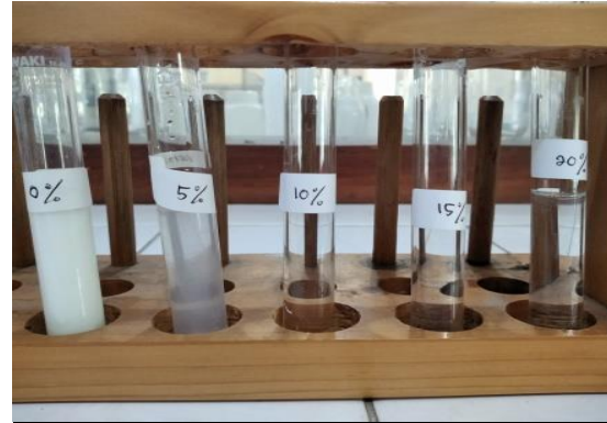
Gambar 1. Larutan TiO 2 dan TiO 2 :(F+In) dengan Persentase Doping 0%, 5%, 10%, 15%, dan 20%

Berikut tampilan larutan sol-gel Titanium Dioksida murni (TiO 2 ) serta dengan diberikan doping campuran Fluorin dan Indium (TiO 2 :F+In) setelah mengalami proses diaging pada suhu ruangan selama 24 jam yang dapat dilihat pada Gambar 1.