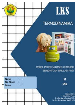
Gambar 1. Sampul LKS

dikembangkan oleh peneliti ditunjukkan oleh Gambar 1: