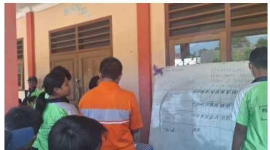
Gambar 6. Rekapitulasi perhitungan suara