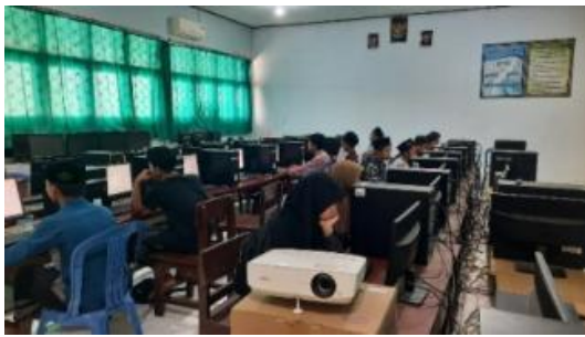
Gambar 2. Tes di laboratorium komputer

Pada hari Rabu, 25 Oktober 2023 dilakukan beberapa tes untuk menyeleksi calon pengurus OSIS dari kelas 7 dan 8. Tes berbasis komputer ini dilakukan di laboratorium komputer. Selanjutnya tes wawancara oleh guru pendamping pada siswa kelas 7 dan 8.