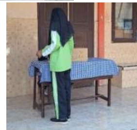
Gambar 5. Kegiatan pemungutan suara