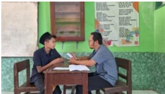
Gambar 3. Tes wawancara oleh guru pendamping

Final dari pelaksanaan kegiatan suara demokrasi OSIS ini adalah pada hari Jumat, 27 Oktober 2023. Kegiatannya bertempat di lapangan sekolah. Dalam kegiatan final ini, siswa yang terpilih menjadi kandidat calon ketua dan wakil ketua OSIS menyampaikan visi dan misinya di depan warga sekolah. Setelah itu semua warga sekolah melakukan pemilihan dengan menggunakan sistem coblos yang kemudian dilanjutkan dengan perhitungan suara oleh guru yang disaksikan seluruh warga sekolah.