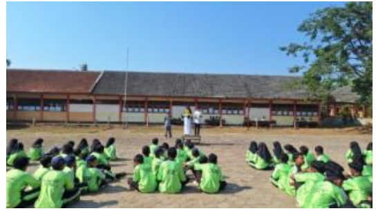
Gambar 4. Penyampaian visi misi setiap calon

Final dari pelaksanaan kegiatan suara demokrasi OSIS ini adalah pada hari Jumat, 27 Oktober 2023. Kegiatannya bertempat di lapangan sekolah. Dalam kegiatan final ini, siswa yang terpilih menjadi kandidat calon ketua dan wakil ketua OSIS menyampaikan visi dan misinya di depan warga sekolah. Setelah itu semua warga sekolah melakukan pemilihan dengan menggunakan sistem coblos yang kemudian dilanjutkan dengan perhitungan suara oleh guru yang disaksikan seluruh warga sekolah.