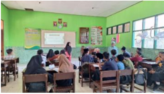
Gambar 1. Penyampaian materi oleh guru pendamping

Pada hari Rabu, 25 Oktober 2023 dilakukan beberapa tes untuk menyeleksi calon pengurus OSIS dari kelas 7 dan 8. Tes berbasis komputer ini dilakukan di laboratorium komputer. Selanjutnya tes wawancara oleh guru pendamping pada siswa kelas 7 dan 8.