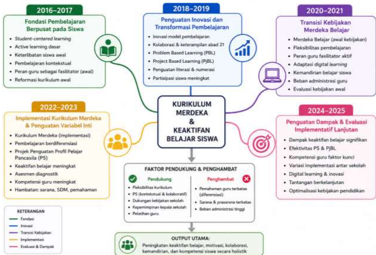
Gambar 2. Perkembangan Kurikulum Merdeka dan Hubungannya dengan Keaktifan Belajar Siswa (2016–2025)

menghadapi keterbatasan kapasitas dan sumber daya pendidikan. Berikut adalah gambaran perkembangan publikasi tentang kurikulum merdeka dan hubungannya dengan keaktifan belajar siswa pada 10 tahun terakhir (2016–2025), seperti terlihat pada Gambar 2.