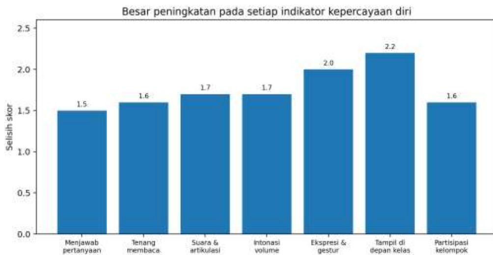
Gambar 4. Besar peningkatan skor observasi deskriptif pada setiap indikator

Berdasarkan Tabel 3 dan Gambar 3, rerata skor awal indikator percaya diri berada pada 1,40 atau 35,0% dari skor maksimal. Setelah latihan membaca ekspresif dan bermain peran, rerata skor meningkat menjadi 3,16 atau 79,0%. Peningkatan terbesar terjadi pada indikator keberanian tampil di depan kelas, yaitu dari 1,2 menjadi 3,4. Hal ini memperlihatkan bahwa pengalaman tampil secara bertahap, dukungan kelompok, dan penguatan guru menjadi faktor penting dalam mengurangi rasa malu siswa. Indikator ekspresi wajah dan gestur juga mengalami perkembangan kuat, dari 1,3 menjadi 3,3. Perubahan ini menunjukkan bahwa siswa mulai mengaitkan pemahaman isi cerita dengan cara penyampaian. Sementara itu, indikator partisipasi kelompok meningkat dari 1,6 menjadi 3,2, yang berarti latihan teater tidak hanya mendorong keberanian individual, tetapi juga menguatkan kerja sama dan keberanian mengambil peran dalam kelompok.