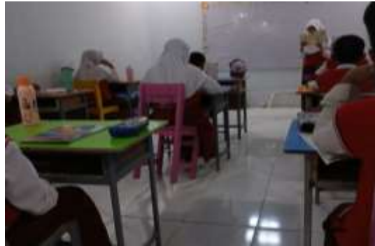
Gambar 1. Siswa yang masih malu dan belum menggunakan gerak tubuh secara optimal