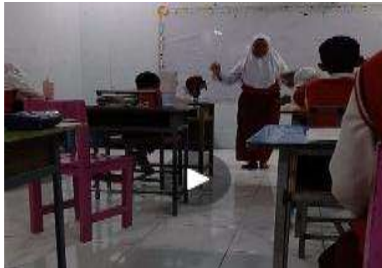
Gambar 2. Siswa mulai berani tampil dengan ekspresi yang lebih sesuai