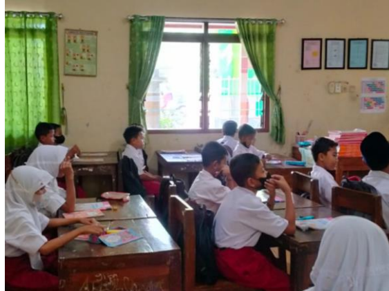
Gambar 1. Pembelajaran Berjalan Kondusif

kondusif. Peserta didik dikatakan disiplin di kelas apabila saling bekerja sama membuat suasana kelas menjadi kondusif dan sungguh – sungguh dalam belajar. Siswa yang baik adalah disaat mereka tau kapan ia melakukan kewajibannya dan mendapatkan haknya.