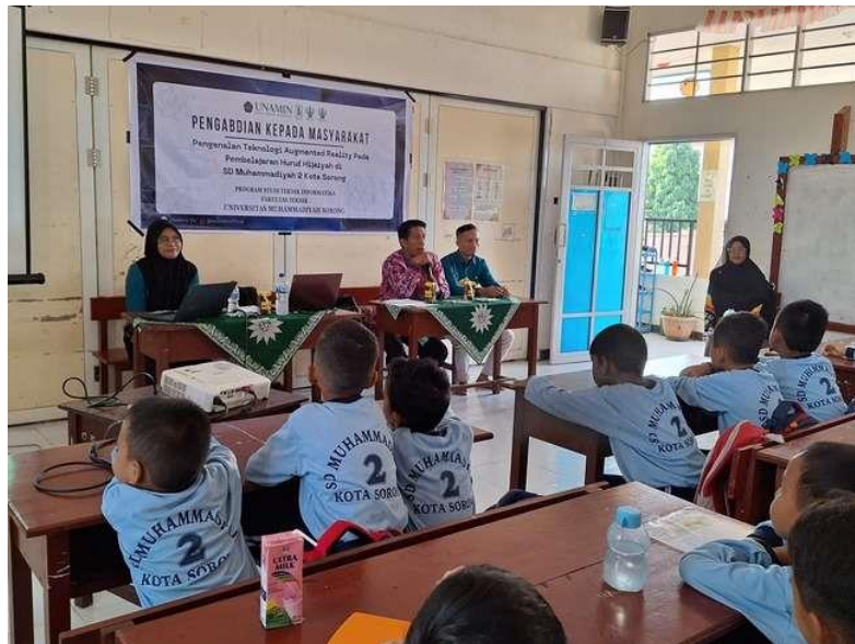
Gambar 1. Pembukaan Kegiatan Pengabdian kepada Masyarakat Oleh Kepala Sekolah

Program pengabdian masyarakat ini telah dilaksanakan pada tanggal 10 November 2023 di SD Muhammadiyah 2 Kota Sorong. Kegiatan ini diikuti oleh siswa siswi pada sekolah tersebut. Walaupun kegiatan ini dikhususkan untuk siswa dan siswi, kegiatan ini juga diikuti oleh orang tua murid dan guru-guru agar nantinya mereka dapat mendampingi anak-anak ini dalam proses pembelajaran menggunakan teknologi Augmented Reality dalam pengenalan huruf hijaiyyah. Pada tahap pertama pelaksanaan pengabdian ini, pelaksana terlebih dahulu melakukan presentasi mengenai Augmented Reality, penerapan Augmented Reality, tentang aplikasi yang dibuat yakni AR Hijaiyyah, dan isi menu pada aplikasinya. Berikut ini adalah foto-foto kegiatan pengabdian pada Masyarakat Siswa SD Muhammadiyah 2 Sorong (Gambar 2-6):