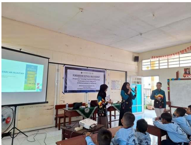
Gambar 3. Pemaparan Aplikasi AR Huruf Hijaiyyah oleh Pemateri