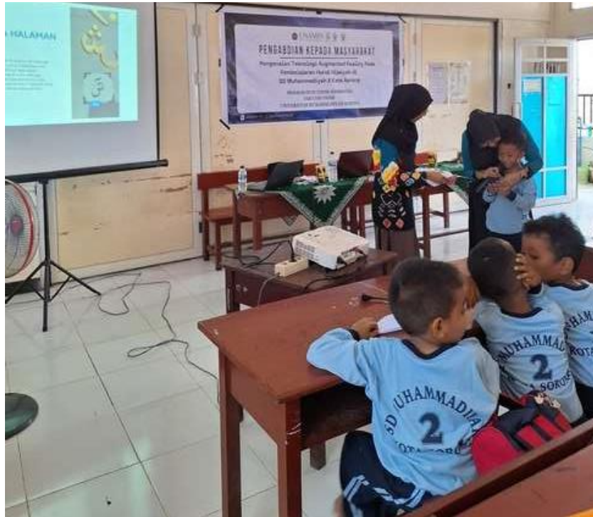
Gambar 4. Uji Coba Aplikasi oleh Siswa SD Muhammdiyah 2 Sorong