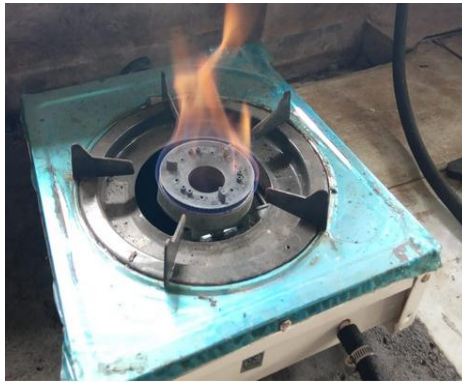
Gambar 4. Biogas limbah cair tahu