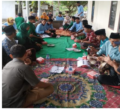
Gambar 2. Kegiatan penyuluhan pengolahan limbah cair tahu menjadi biogas