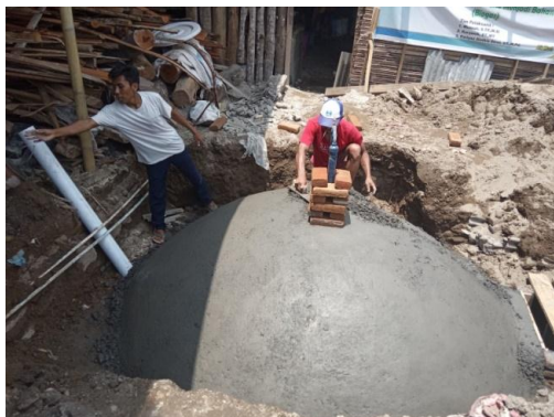
Gambar 3. Digester produksi limbah cair tahu menjadi biogas

outlet tempat keluarnya bioslurry limbah cair tahu setelah terambil gasnya. Serta komponen lainnya seperti manometer, Pipa Gas Utama (PGU), waterdrain, dan kompor biogas.