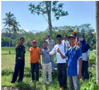
Gambar 2. Koordinasi Lapangan Antara Tim Dan Pemerintah Desa

dari Universitas Muhammadiyah Jember akan memberikan penyuluhan dan Pelatihan bagi para Tukang. Kedua, Pemerintah desa akan menjadi mitra yang siap memfasilitasi tempat dan semua peralatan yang dibutuhkan dalam kegiatan Program Kemitraan Masyarakat Stimulus ini. Ketiga, Para Tukang dan Warga akan menjadi peserta kegiatan PKMS ini.