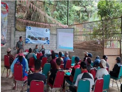
Gambar 3. Penyampaian Teori Teknologi Ferosemen dan Beton Bertulang Bambu

Kegiatan PKMS ini dihadiri 20 Tukang dari 3 Dusun.