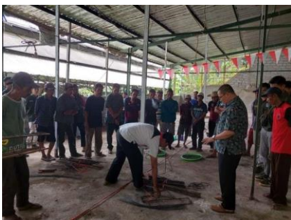
Gambar 4. Praktek Membuat Ferosemen

Alat yang diperlukan untuk membuat ferosemen terdiri dari palu, pahat, roskam, cangkul, sendok semen, gunting kawat, ember serta botol kecap.