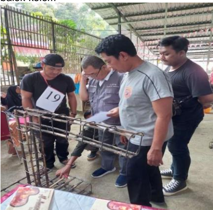
Gambar 5. Praktek Membuat Beton Bertulang Bambu

tulangan bambu. Bambu yang telah kering, dibersihkan pada sisi dalam dan dipangkas dengan mesin gerinda menjadi bentuk tulangan beton berukuran 15 x 15 mm 2 . Perapian permukaan tulangan bambu dengan mesin gerinda. Persiapan bahan dan alat yang terdiri dari tulangan bambu, lapis kedap air, pasir halus, penjepit selang, dan sikat. Pelapisan perekat lapis kedap air pada tulangan bambu. Pelaburan pasir pada tulangan bambu. Perangkaian tulangan bambu untuk pondasi, kolom, balok, dan hubungan balok-kolom