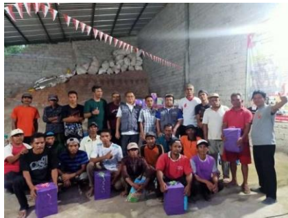
Gambar 7. Penguatan Kelompok Tukang

Dengan adanya kegiatan PKMS ini, maka keterampilan tukang bertambah baik secara kuantitas maupun kualitas. Pada periode sebelumnya para tukang dilatih untuk membuat beton bertulang bambu, pada saat ini tukang diberi tambahan keterampilan dengan menerapkan teknologi ferosemen.