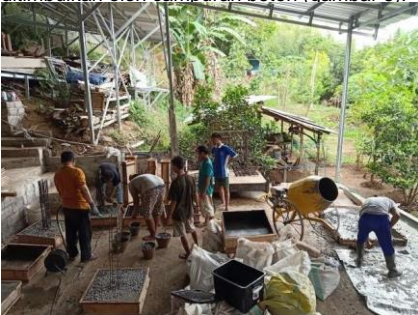
Gambar 6. Praktek Pengecoran Tulangan Bambu

Setelah bambu dirangkai sebagai tulangan pondasi, tulangan kolom serta tulangan balok, praktek terakhir yang dilakukan adalah cara mengecor. Dalam mengecor tulangan ini tukang harus memperhatikan agar tulangan tetap lurus, presisi tidak tertekan oleh beban yang ditimbulkan oleh campuran beton (gambar 6).