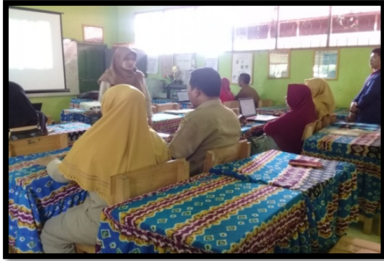
Gambar 2. Pendampingan