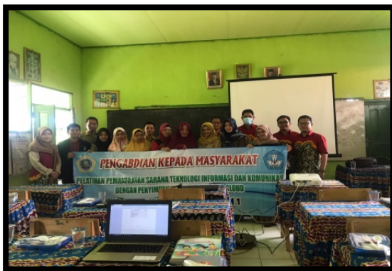
Gambar 3. Sesi setelah selesai pengabdian

Praktek mandiri yang dilakukan berjalan dengan baik ini di buktikan dengan dapat berhasilnya peserta membuat dan mempraktekanya dari materi yang di sampaikan dari mempraktekan google drive,dropbox,one drive dan icloud sehingga dapat menjadi penunjang kelancaran dalam proses belajar mengajar.